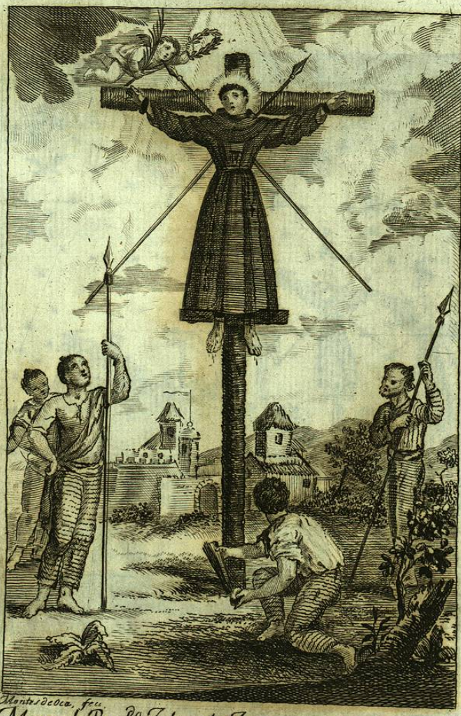
Monteideo, f.º Muere el Bien. do Felipe de Jesus, el primero de sus Compañeros, Crucificado y es atravesado con tres Lanzas, logrando por esto la Palma de Proto-Martir, entre aquellos mismos Proto-Martires

Faint, illegible text at the bottom of the left page, possibly bleed-through from the reverse side.