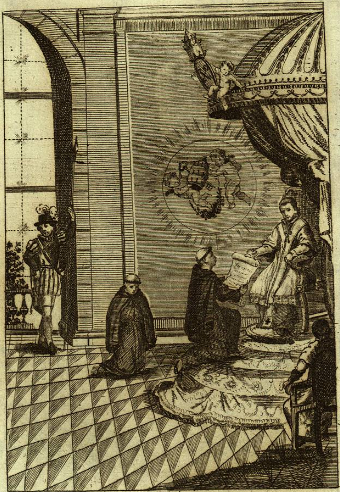
Dada Bula de la Beatificacion de Felipe, nuestro Santo, Padre Urbano Octavo á catorce de Septiembre del Año 1627.