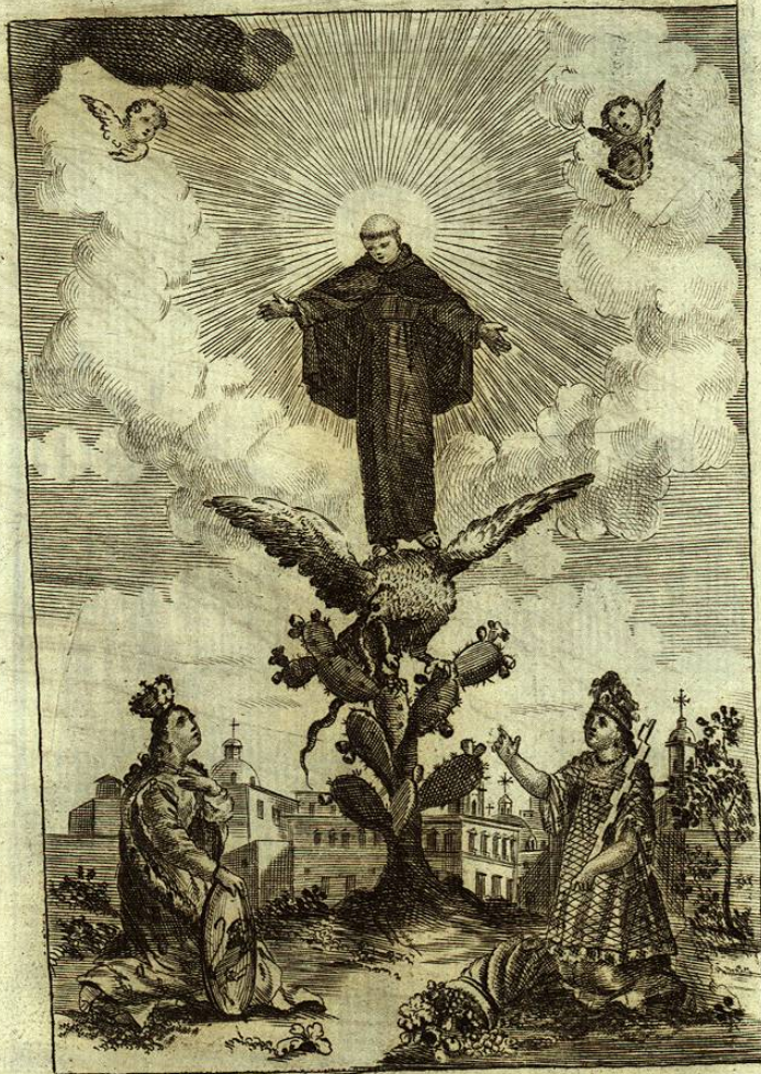
Nombra la afortunada Mexico por Patron principal al Bienaventurado Felipe de Jesus, a quien le dio la Cuna

[Faint, illegible text, likely bleed-through from the reverse side of the page.]