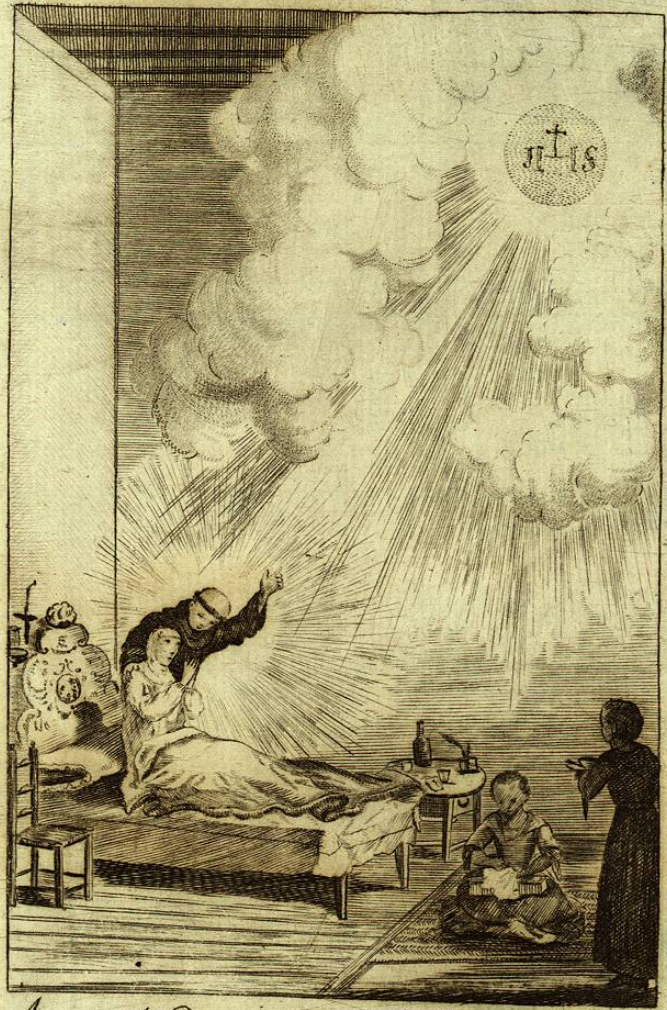
Aparece el Bienaventurado Felipe de Jesus, á su Madre á la hora de la Muerte.

[Faint, illegible text, likely bleed-through from the reverse side of the page.]