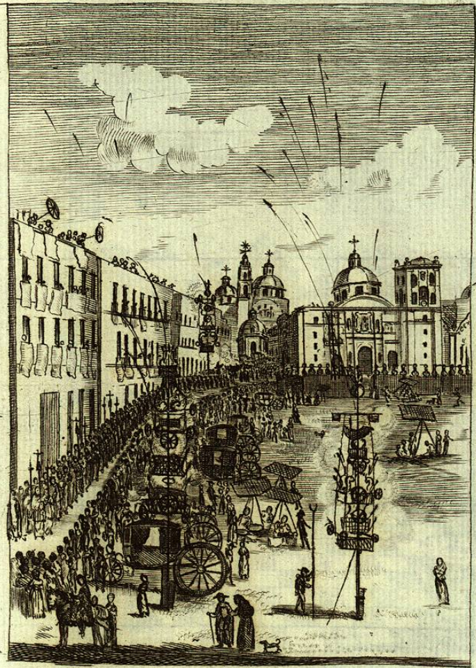
Celebra Regozijada Mexico, la Beatificacion de su Esclarecido hijo el Bienaventurado Felipe de Jesus