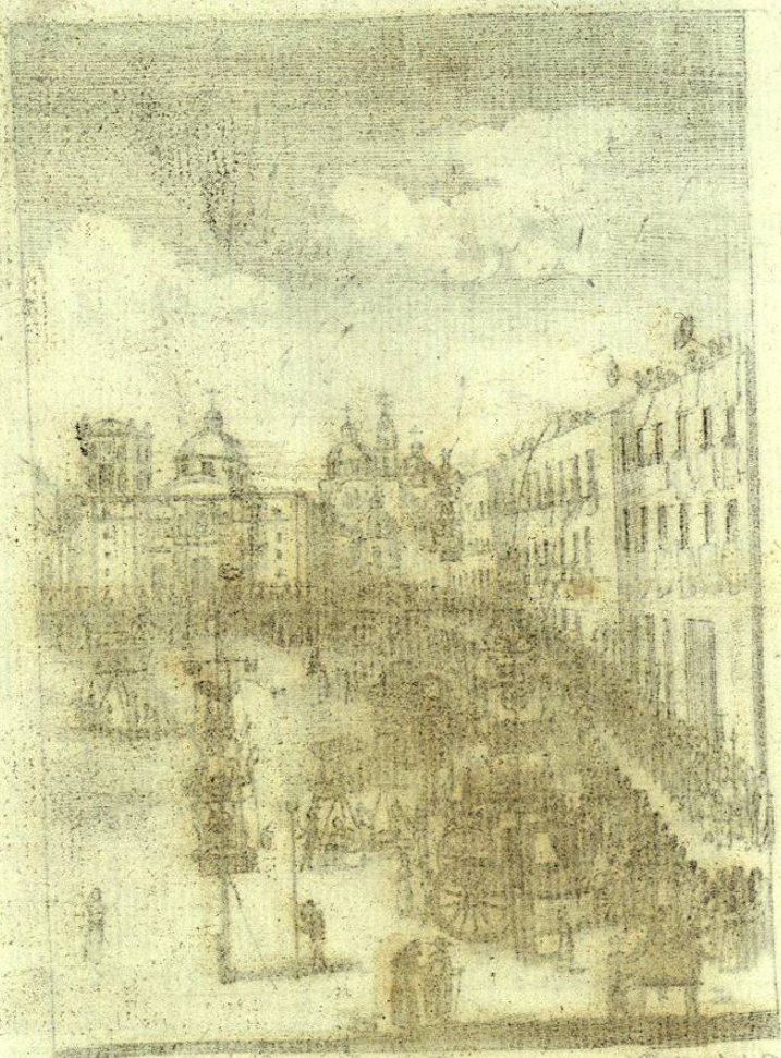
Calles y edificios de la Ciudad de Mexico