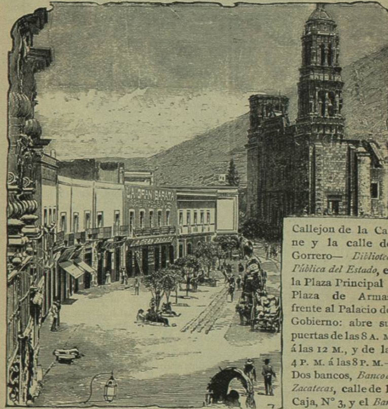
VISTA DE CATEDRAL Y DE LA CALLE ALDAMA—Zacatecas. calle de Tacuba, N° 23— Cárcel de Zacatecas , en la Plazuela de Santo Domingo— Casa de Moneda , calle del Correo, al lado del Ensaye Principal , esquina de la misma calle del Correo y del Callejon de San Agustin: abre sus puertas

La Oficina telegráfica del Central Mexicano está situada en la Plazuela de San Agustin, N° 21— Expreso de Wells, Fargo y Cia. , Plazuela de San Agustin N° 17, bajos del Hotel Zacatecano— Administracion de Correos , calle del Correo, N° 18, en la Plazuela de Santo Domingo— Telégrafos Federales , calle del Correo, N° 9— Compañía Telegráfica y Telefónica del Estado de Zacatecas , Plaza Principal, en el Palacio del Gobierno.— Palacio Municipal , frente al Jardín Juarez, entre el