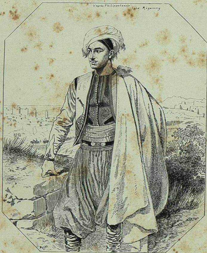
LE MARÉCHAL DES LOGIS DU BARAIL