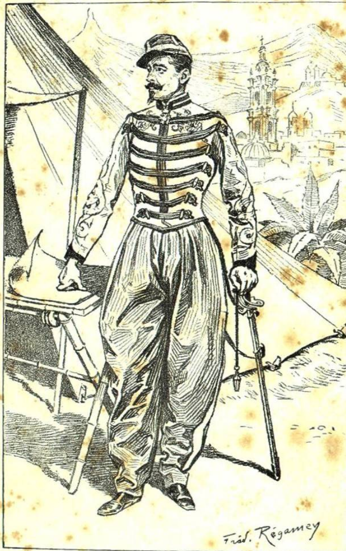
LE COLONEL DU BARAIL