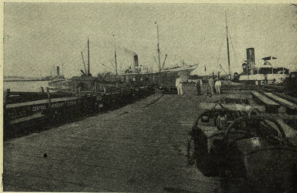
VISTA DEL PUERTO DE TAMPICO

En el año 1883 se instaló en la margen izquierda de la boca del Pánuco, un faro de 2.º orden, luz blanca, destello triple cada treinta segundos, poder 3.619 lámparas Cárcel, alcance luminoso 55 millas en tiempo claro, alcance geográfico 18.5, sobre una torre exagonal de hierro, pintada de rojo, con altura de 43 metros y 30 centímetros.