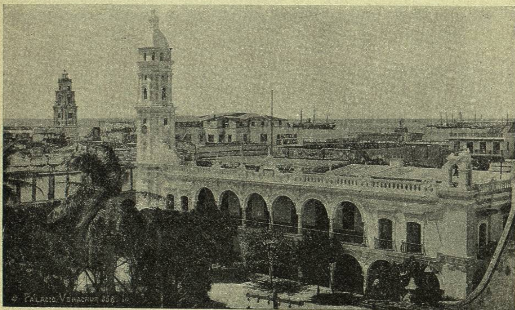
VISTA DEL PUERTO DE VERACRUZ

Alvarado, Coatzacoalcos, Frontera y Carmen son otros puertos menos importantes del Golfo, y en la península de Yucatán podemos indicar como principales los de Campeche y Progreso ya citados, el primero de los cuales fué de gran movimiento en el tiempo colonial, habiendo decaído mucho, hasta hoy que parece querer recobrar su antiguo esplendor merced á las obras que también en él se practican y al ferrocarril de Mérida que vino á prestarle nueva vida y actividad.