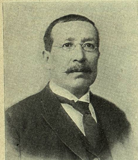
LIC. APOLINAR CASTILLO Presidente de la Cámara de Senadores en la legislatura de 1896-98

Los períodos de sesiones de este Cuerpo legislativo son los mismos de la Cámara de Diputados, y como ella nombra en cada receso una comisión permanente compuesta de catorce senadores, con iguales facultades que la de Diputados.