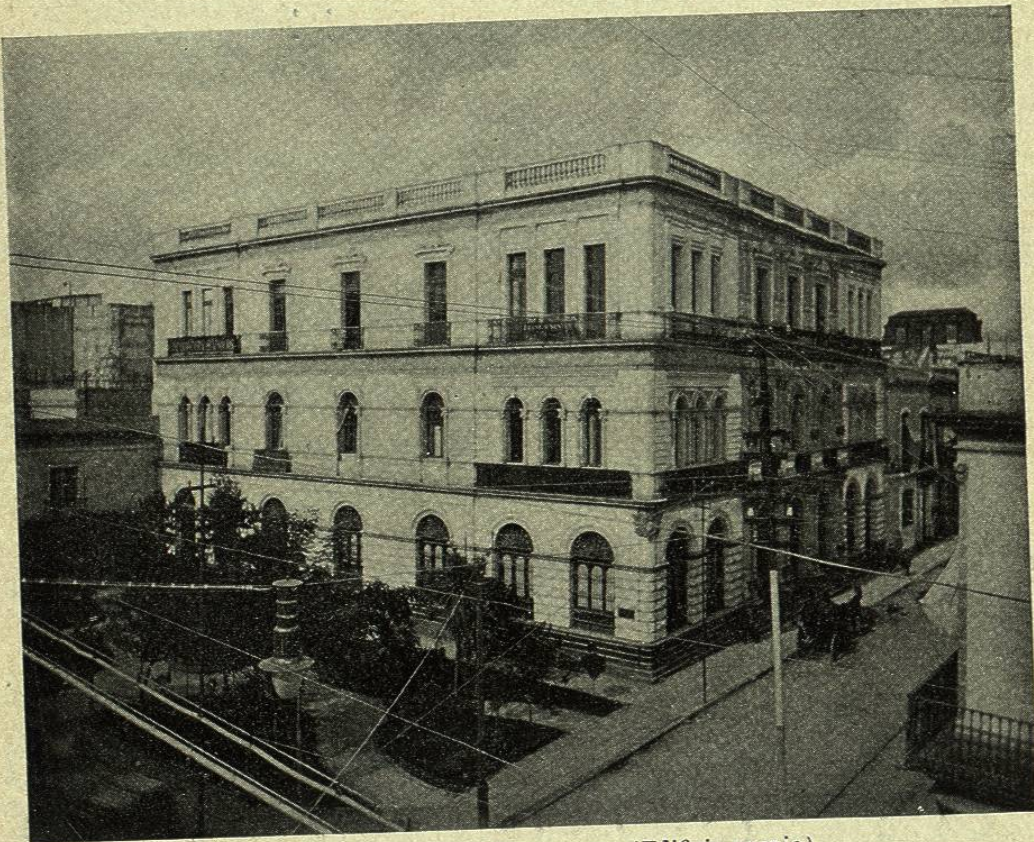
BANCO INTERNACIONAL HIPOTECARIO (Edificio propio)

Inútil nos parece indicar aquí los servicios que el país debe á este Banco, porque bien sabido es que en todas partes donde se establecieron los bancos de crédito territorial resultaron beneficiosos, prosperando rápidamente y haciendo prosperar á los pueblos enclavados en su radio de acción cuando el establecimiento, como en el presente caso, es una sociedad anónima, sin ingerencia en ella por parte de los gobiernos y exenta por lo tanto de los abusos políticos que se ven frecuentemente en los bancos de carácter oficial. Ejemplos de lo que decimos nos ofrecen, en el primer caso, la conocida sociedad Crédit Foncier y en el segundo los bancos hipotecarios oficiales de algunos países, especialmente los de la República Argentina, cuyo fracaso todos conocemos.