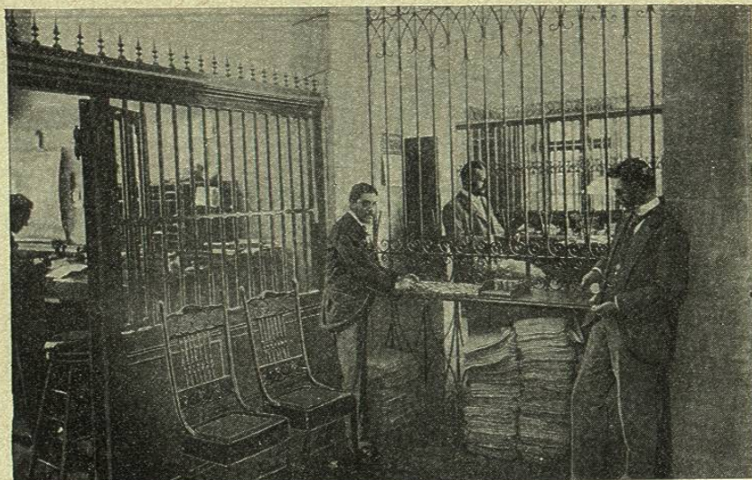
ESCRITORIO DE LOS SRES. KOSIDÓWSKI Y C. A