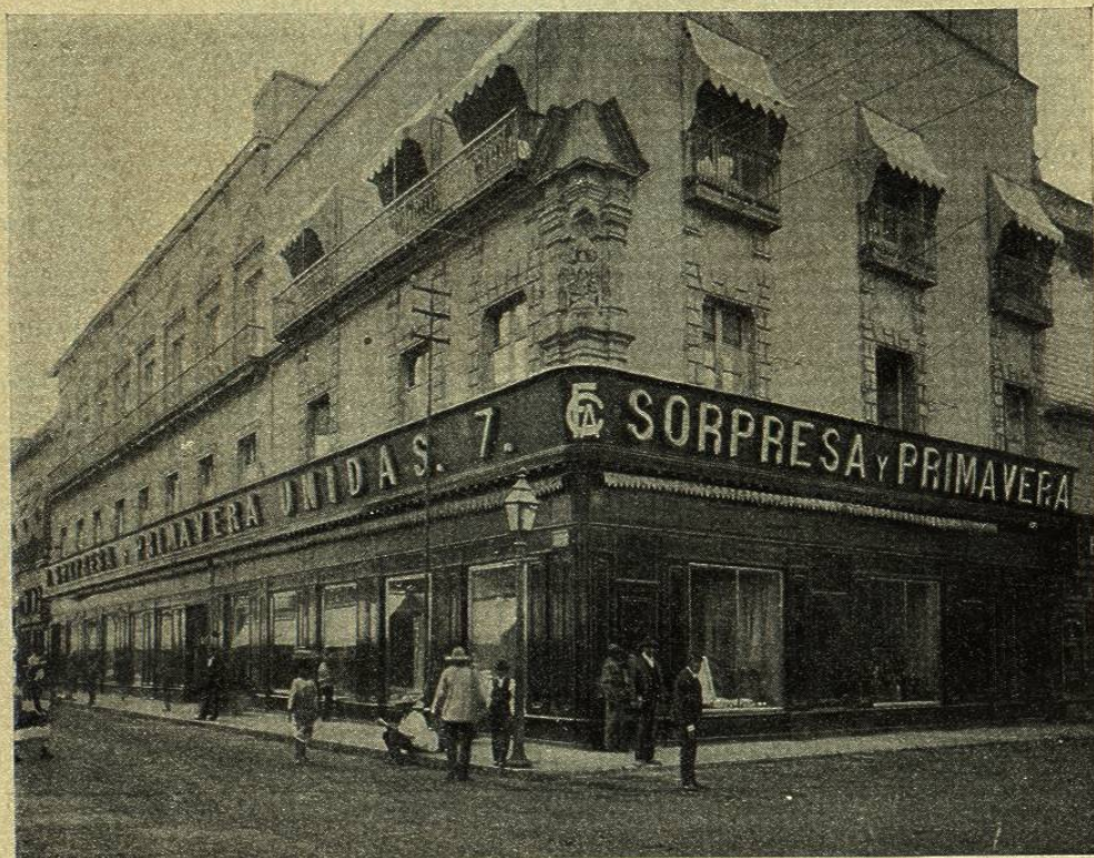
DESPACHO Y ALMACENES DE LA CASA SORPRESA Y PRIMAVERA UNIDAS

Como su nombre lo indica, este inmenso establecimiento está formado de las antiguas casas La Sorpresa y La Primavera que vinieron á ser una sola en poder de los Sres. A. Fourcade y C. as