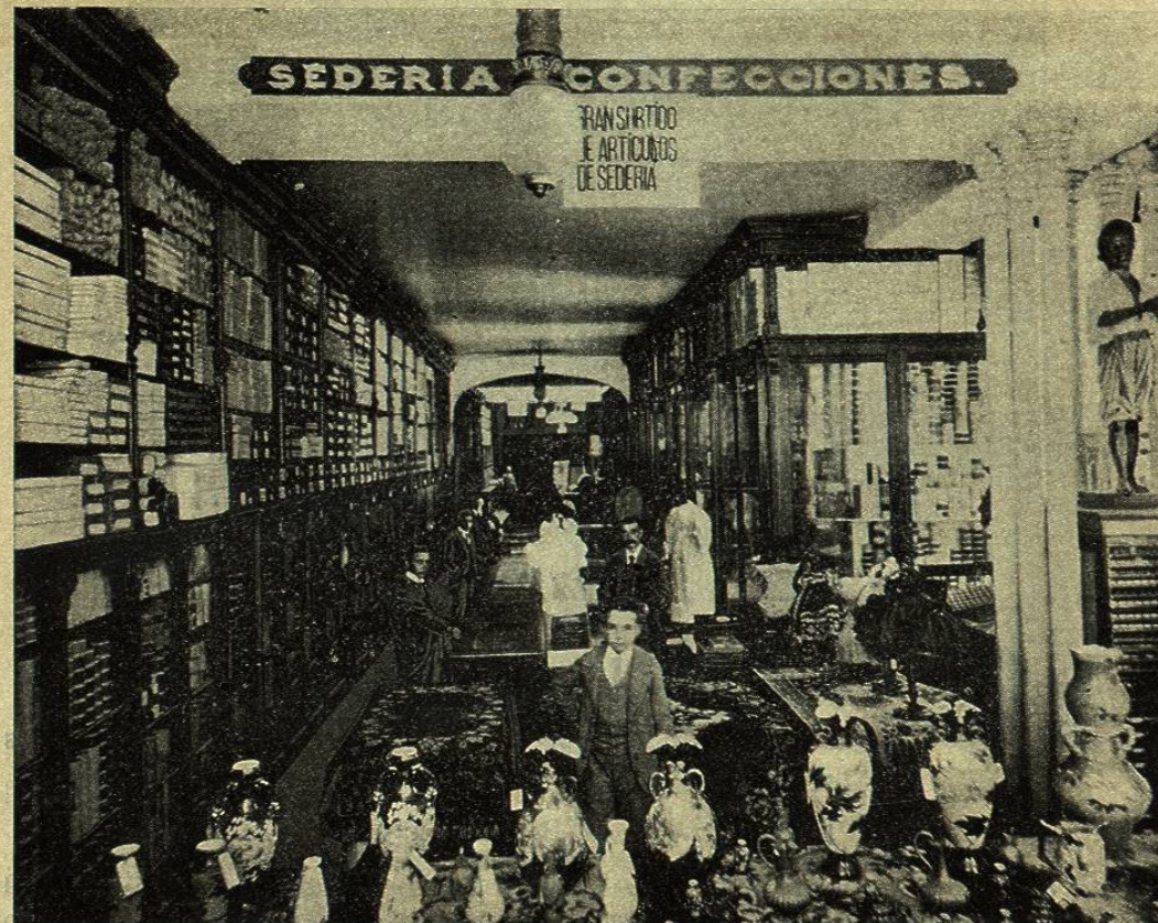
ÁLMACENES Y DESPACHO DE EL SURTIDOR

Quisiéramos poder dedicar todo el espacio que estos grandes almacenes de novedades llamados El Surtidor exigirían para dar una idea de su inmenso, rico y variado surtido, y especialmente del exquisito gusto y elegancia con que sus propietarios saben exponer al público aquella inapreciable variedad de géneros que ocupan las anaquelarias de los vastos departamentos de la casa; pero desgraciada-