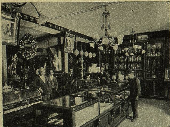
MOSTRADORES DE LA PARISIËN

Cuanto objeto de lujo y arte pueda desearse, para decorar elegante y aristocráticamente una casa, se encuentra en La Parisiën , y por muy delicado que sea