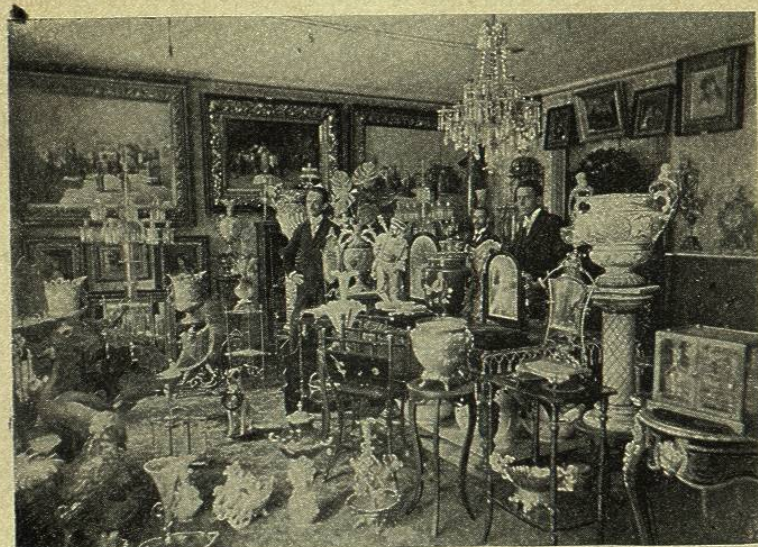
INTERIOR DE LA PARISIËN

oído los elogios que los aficionados á tan elegante juego les prodigaban, ensalzando unos el buen sistema de barandas elásticas, otros el fino paño que recubre la mesa y todos, la perfecta horizontalidad de la tabla.