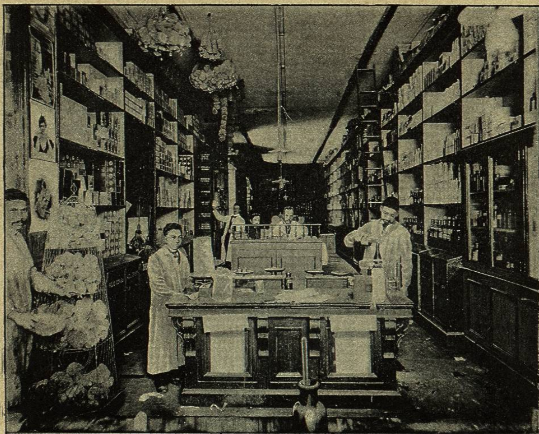
SECCIÓN DE DESPACHO AL PÚBLICO

Zuleta, próximo al Banco Hipotecario y al lado de la gran fábrica de pianos de Wagner y Levien.