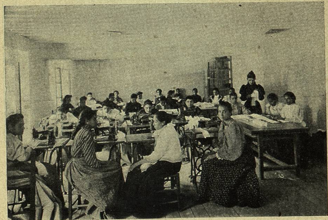
TALLER DE COSTURAS