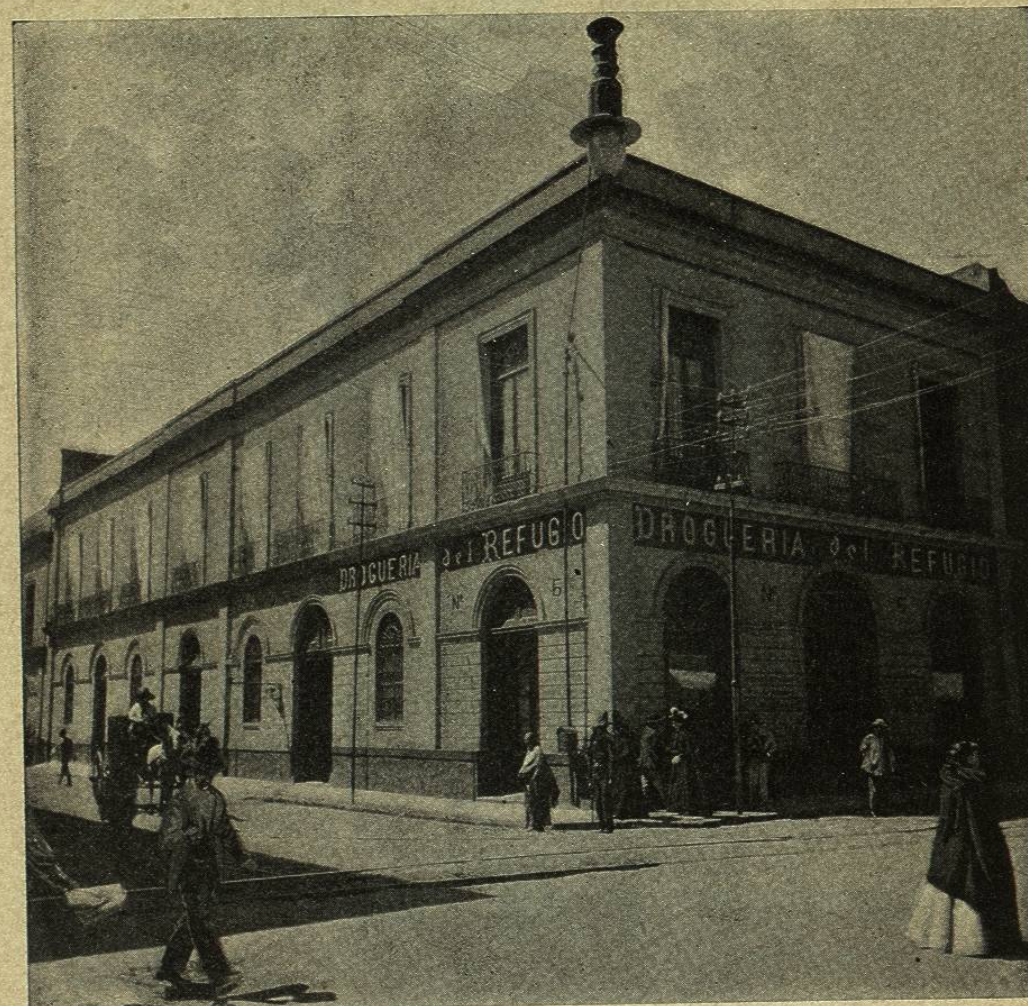
GRAN DROGUERÍA DEL REFUGIO

Banco Nacional, próxima á la plaza de la Constitución, y en una palabra, situada en el propio corazón de la ciudad, ocupa ventajosa posición para desarrollar sus negocios, al punto de que sus mostradores se hallan siempre concurridísimos y realiza ventas de gran importancia, tomando diario incremento el crédito de esta casa, ya de antiguo muy sólido y bien cimentado.