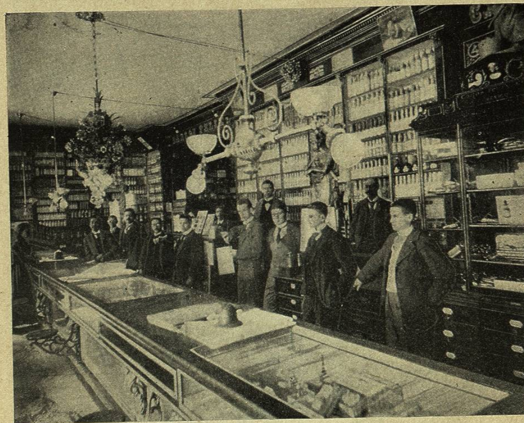
INTERIOR DE LA DROGUERÍA DE LA PALMA