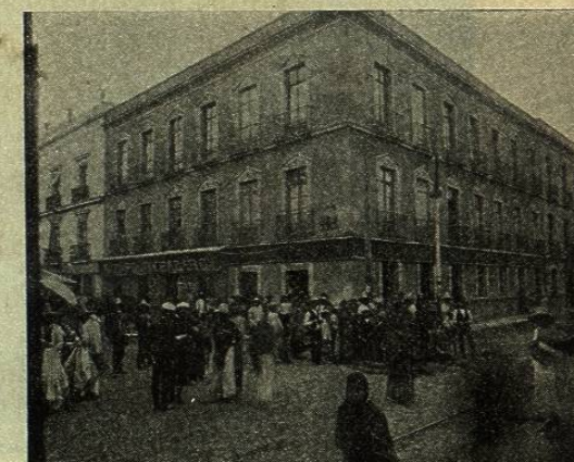
GRAN ALMACÉN DE SANTOVEÑA HERMANOS

Esta casa, que se dedica al ramo de abarrotes nacionales y extranjeros, ó sea al despacho de bebidas y comestibles, está situada en el mejor punto de la ciudad para tal clase de comercio, ó sea frente al gran Mercado de la Merced, quizá el más concurrido de la ciudad.