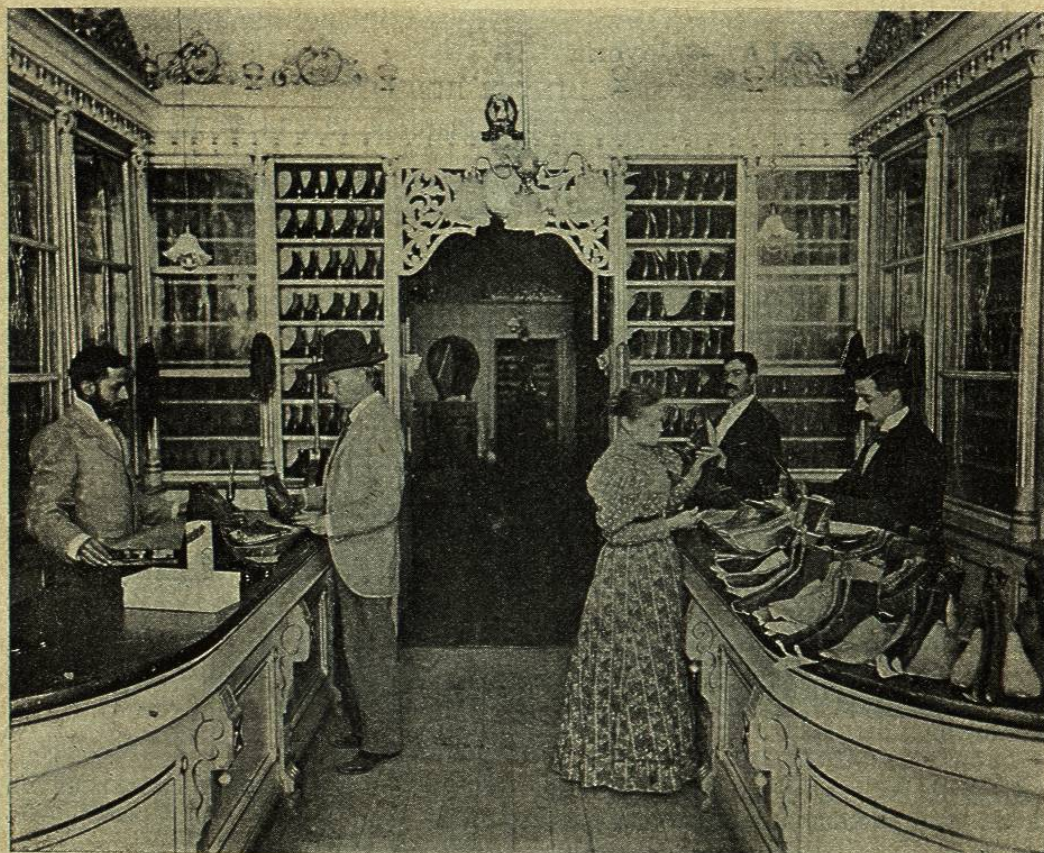
INTERIOR DE LA ZAPATERÍA LOS ASTURIANOS