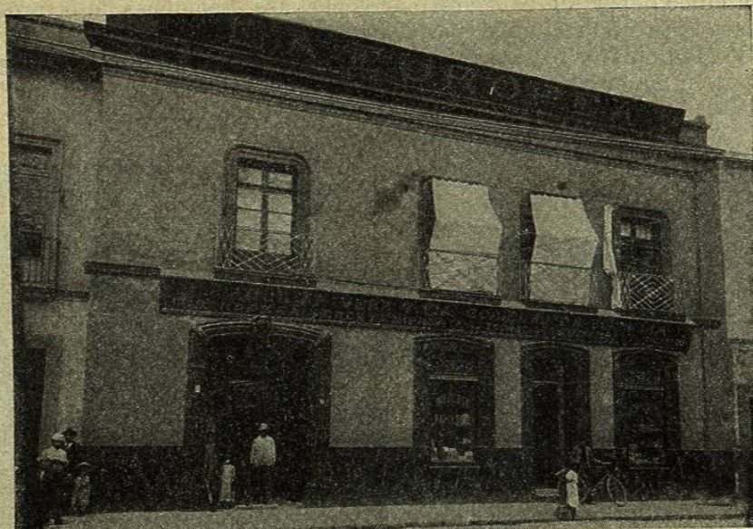
IMPRESA Y LITOGRAFÍA LA EUROPEA

Calle de Santa Isabel, núm. 9. — MÉXICO.