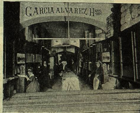
INTERIOR DE LA REBOJERÍA EL VAPOR

rez Hermanos, acreditados é inteligentes comerciantes que pueden con justicia figurar en primera fila entre los del mismo giro. Su magnífico establecimiento, situado en el punto más céntrico de la capital, en el número 10 de la calle Puente de Palacio, no necesita recomendación alguna por nuestra parte: en toda la República es ventajosamente conocido, tanto por la buena y variada clase de sus rebozos y zarapes que fabrica, cuanto por la existencia inmejorable de hilados y tejidos del país, lo mismo que por la de materia prima, como hilo planchado, hilazas inglesas, seda, etcétera, que importa directamente de los centros de producción.