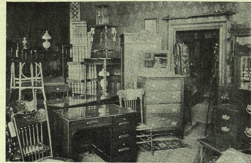
INTERIOR DE LA MUEBLERÍA AMERICAN FURNITURE

distinguen los muebles de esta fábrica es la duración experimentada en todos aquellos que llevan vendidos al público desde que se instaló entre nosotros.