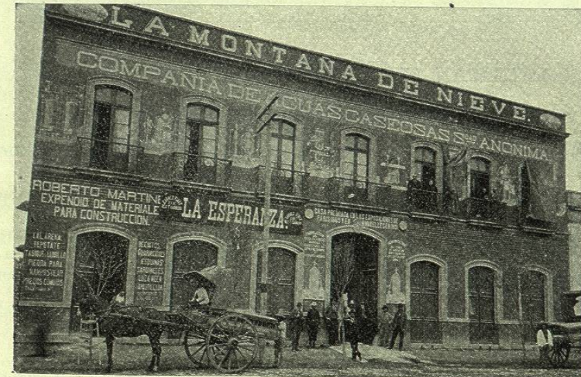
LA MONTAÑA DE NIEVE, FÁBRICA DE AGUAS GASEOSAS

Casa premiada en la Exposición de París en 1889 y en la Academia Universal de Ciencias y Artes industriales de Bruselas en 1891 con medalla de primera clase y diploma de honor.