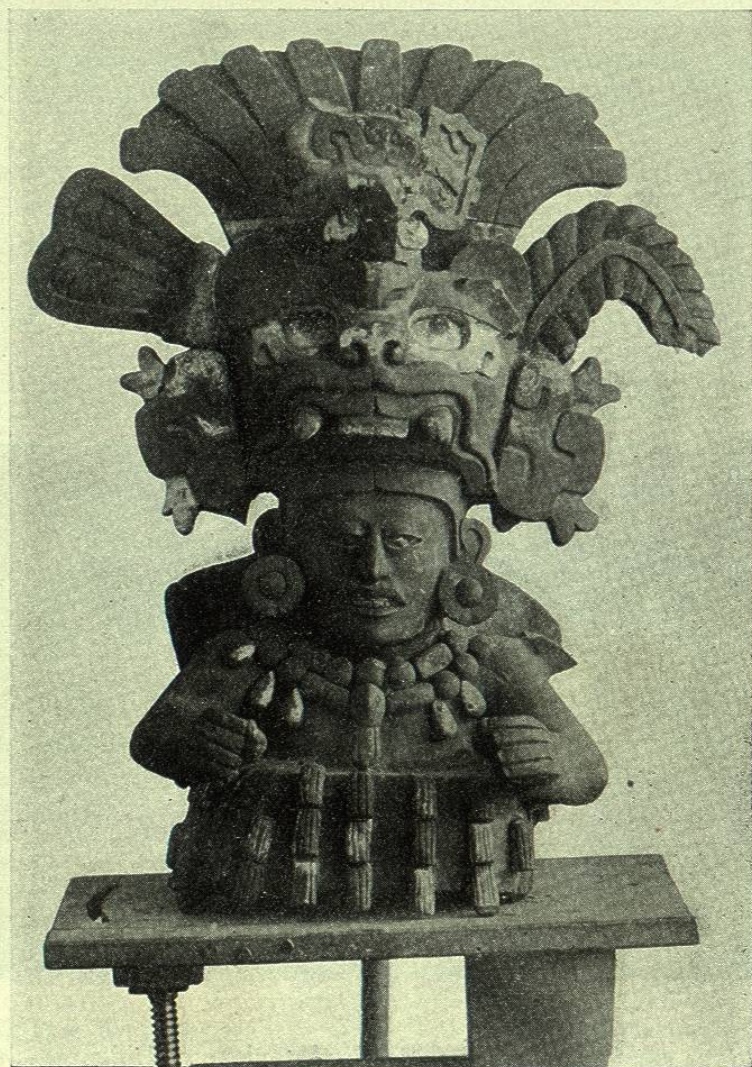
ÍDOLO ZAPOTECA VISTO DE FRENTE

á costa de mil fatigas reúnen los propietarios de esta importante Curiosity house . Sabido es que el elemento americano padece verdadera fiebre por adquirir objetos antiguos que revelan la industria, los conocimientos y las costumbres de las poblaciones indígenas de México, y á la sombra de esta pasión por los idolillos, los cuchillos de obsidiana y los ejemplares de una curiosa alfarería, se establecieron