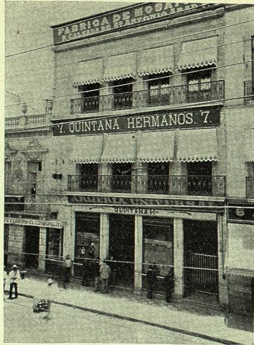
QUINTANA HERMANOS. — Gran armería