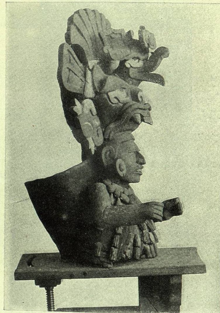
ÍDOLO ZAPOTECA VISTO DE PERFIL

El grabado que publicamos en estas líneas representa un ídolo zapoteca, hallado recientemente por el Sr. Batres en las excavaciones practicadas en los sepulcros de Xoxo, y que Spaulding se apresuró á fotografiar para darlo á conocer.