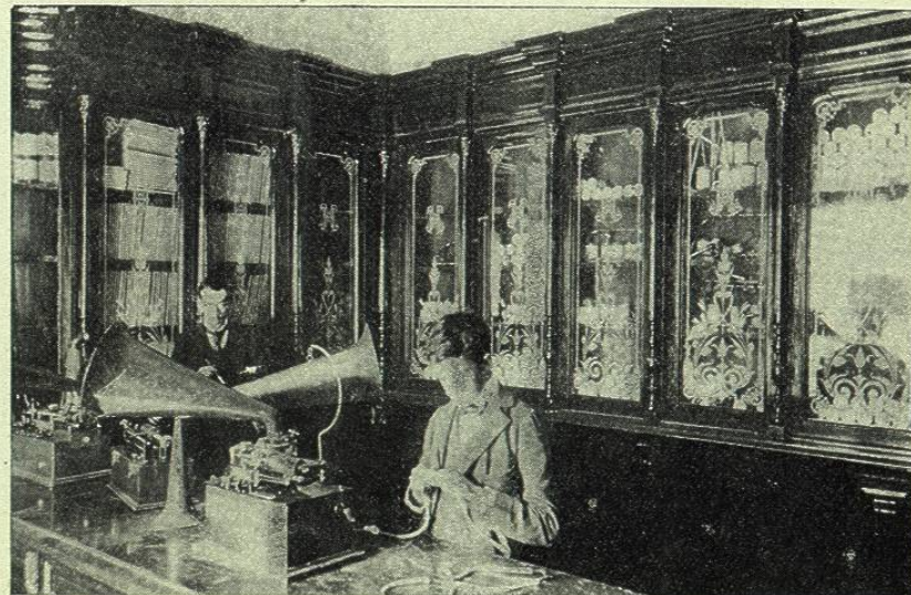
DESPACHO DE HERNÁNDEZ HERMANOS

De todos los inventos que produjo entre los sabios observadores la fé de aquella teoría, ninguno más maravilloso que el invento del fonógrafo. El vino á ofrecernos un medio de eternizarnos por decirlo así, fotografiando los sonidos de nuestra voz, de tal modo, que se puede reproducirla muchos años después de que hayamos desaparecido en el abismo del no ser. El vino á nosotros acompañado de su no menos maravillosa hermana la fotografía del movimiento para consolarnos en las aflicciones que nos produce el ansia insaciable de prolongar nuestra existencia.