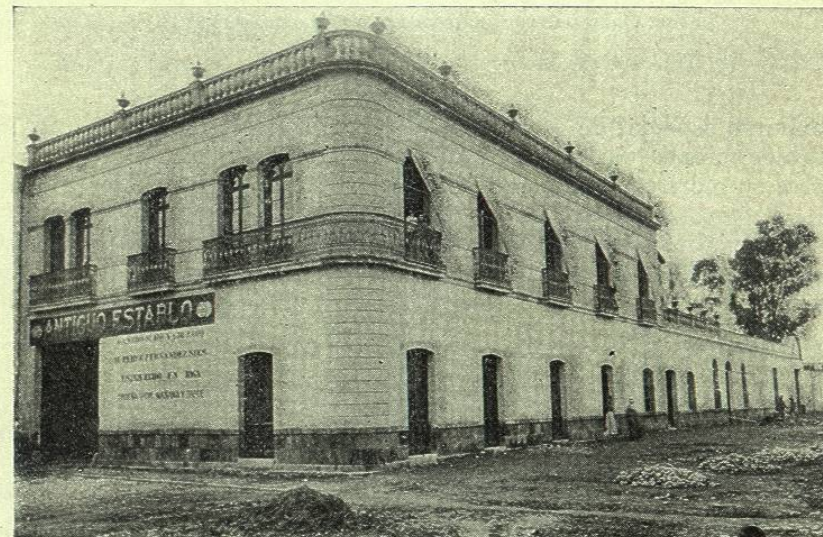
EDIFICIO EXTERIOR DEL ESTABLO DEL SR. ALENTÁ

Se encuentra en la plazuela de Necatitlan, n.º 1, y encierra nada menos que 300 cabezas de ganado vacuno, todo de razas finas, holandesa y suiza, produciendo diariamente mil litros de leche.