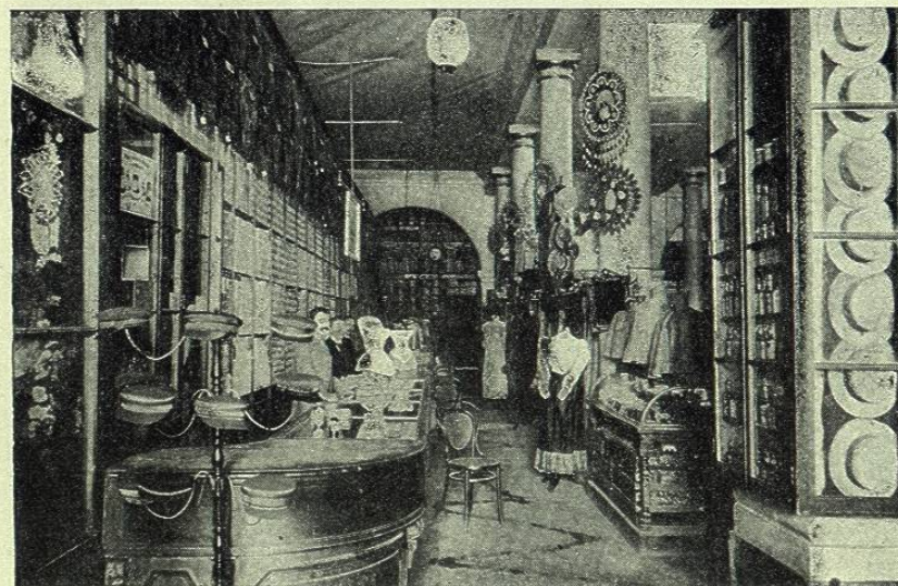
ALMACENES DE LA BELLA JARDINERA

En otro lugar hablamos de los hermosos Portales de la Diputación y de las Flores, que forman una amplia vía cubierta, orlada por la parte del Sur de espléndidas casas de comercio.