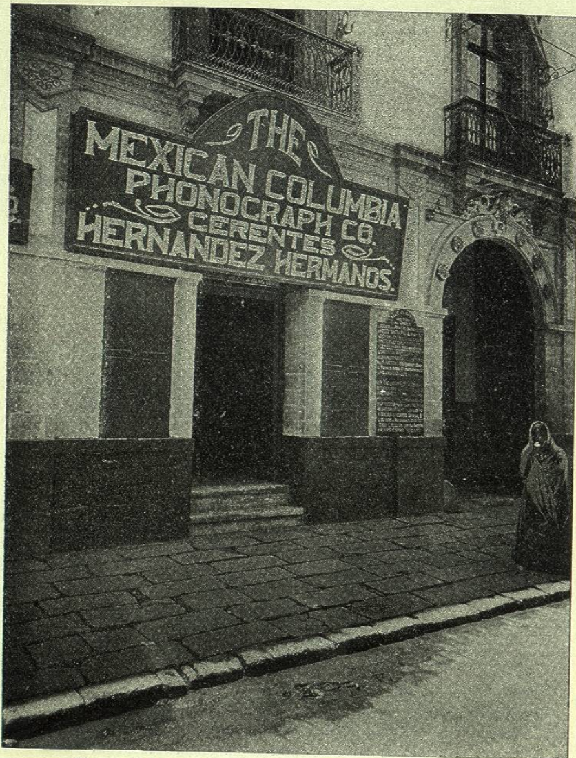
VISTA DE LA CASA DE COMERCIO DE HERNANDEZ HERMANOS

Desde que apareció en el campo de la ciencia experimental la teoría atómica y la de las vibraciones moleculares, asombrosas invenciones ocurrieron que ilustrarán nuestro siglo y lo harán de respetable memoria para las generaciones venide-