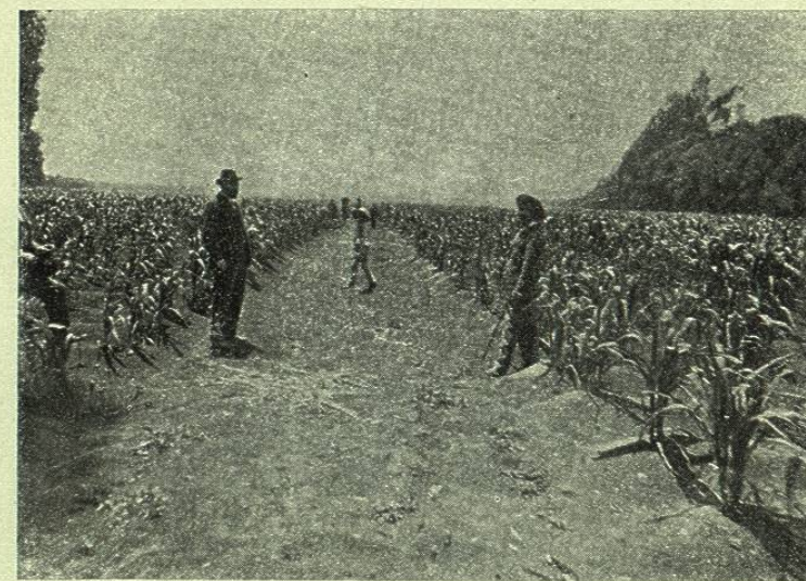
PLANTACIÓN DE MAÍZ EN LA HACIENDA DE COAPA

Hernán Cortés, en sus cartas á Carlos V, y los conquistadores-cronistas de aquellos tiempos, prodigan entusiastas elogios á este valle encantador, y no ocultan el asombro que les produjo verlo cuando al ascender por las cumbres de la sierra oriental, se desarrolló ante su vista tan espléndido panorama. Entonces eran sólo la Naturaleza y las miserables chozas de los indios lo que lo engalanaban; hoy la civilización moderna levantó los palacios y las torres de los templos en los pueblos de la llanura; tendió los caminos de hierro por los que se desliza rauda la locomotora, arrojando penachos de humo que se reflejan en las tersas aguas del Texcoco , y puso en los campos de esmeralda la mancha amarilla de los ganados, nota armónica de un paisaje antes desconocida en la virgen América.