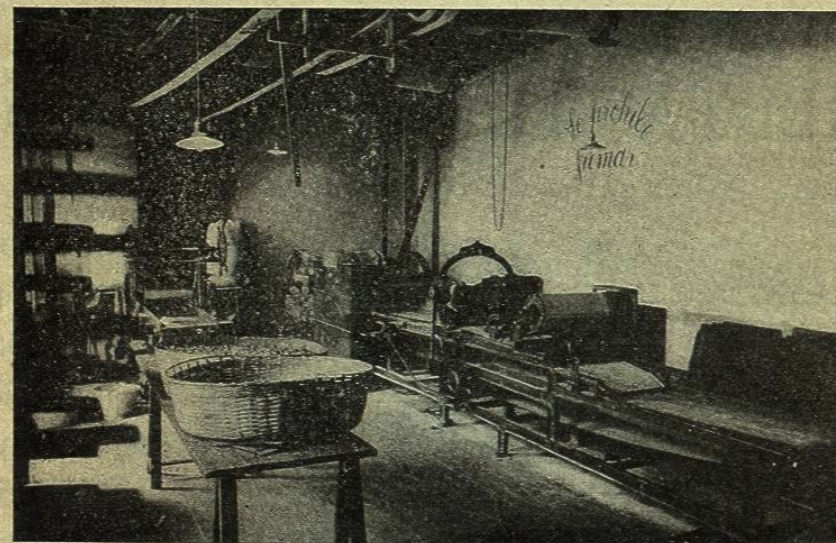
Máquinas en la fabrica de pastas