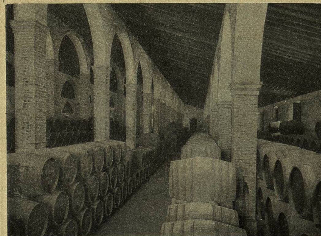
Bodegas y Escritorios: Calle Lechugas, 6 y 8