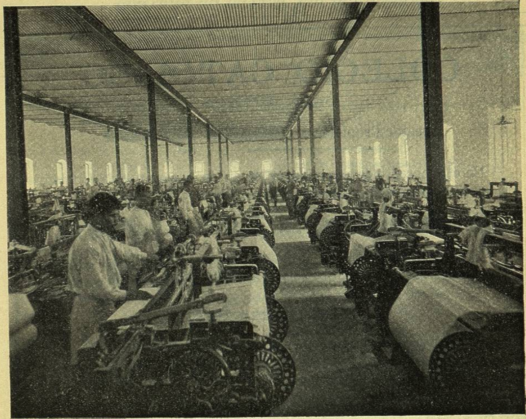
SALÓN DE TEJIDOS EN LA FÁBRICA LA AMISTAD