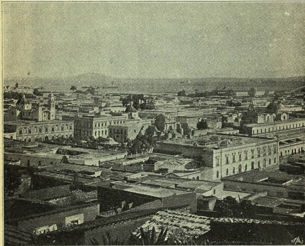
TOLUCA.— VISTA PANORÁMICA DE LA CIUDAD

administrativa que presta orden y método á la marcha de la Escuela. Cuenta actualmente con 110 alumnos internos y 109 externos, matriculados para el aprendizaje de los oficios y artes siguientes: carpintería, curtiduría, doraduría, esferas, encuadernación, herrería, hojalatería, imprenta, litografía, modelado, mecánica, sastrería, zapatería, teneduría de libros, música y dibujo, para la enseñanza de los cuales, hay en la Escuela grandes talleres provistos de materiales y herramientas en abundancia. Atienden el establecimiento 1 Director, 1 Prefecto, 13 Maestros de taller y 63 Oficiales, costando al erario $ 52.253,45 anualmente.