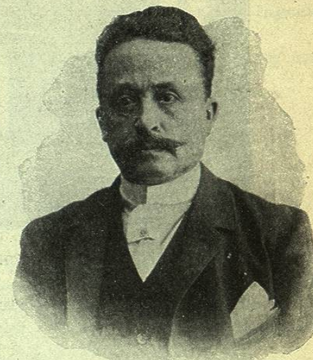
GENERAL D. JOSÉ VICENTE VILLADA Gobernador del Estado de México

En la lucha tenaz y épica de los mexicanos contra la invasión francesa, el señor Villada figuró siempre en los puntos de peligro y obtuvo algunos triunfos notables, como el de Zamora, donde derrotó, al frente de su batallón Guía del Ejército , á un numeroso cuerpo de franceses: después en las tristes luchas civiles que ensangrentaron los fértiles campos de México, peleó con bravura en defensa siempre de sus ideales de libertad é igualdad. Varias veces corrió serios peligros y en dos ocasiones fué hecho prisionero y estuvo á punto de ser fusilado, salvándolo varios jefes y oficiales del bando contrario que no quisieron consentir en el sacrificio de un hombre como Villada á quien debían la vida infinitad