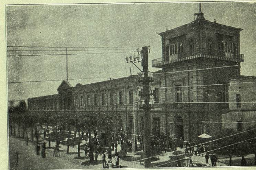
TOLUCA.— EL INSTITUTO CIENTÍFICO Y LITERARIO

Hay en el interior del Instituto amplios é higiénicos salones de clase y muy bien nutridos gabinetes de Física, Química é Historia Natural.