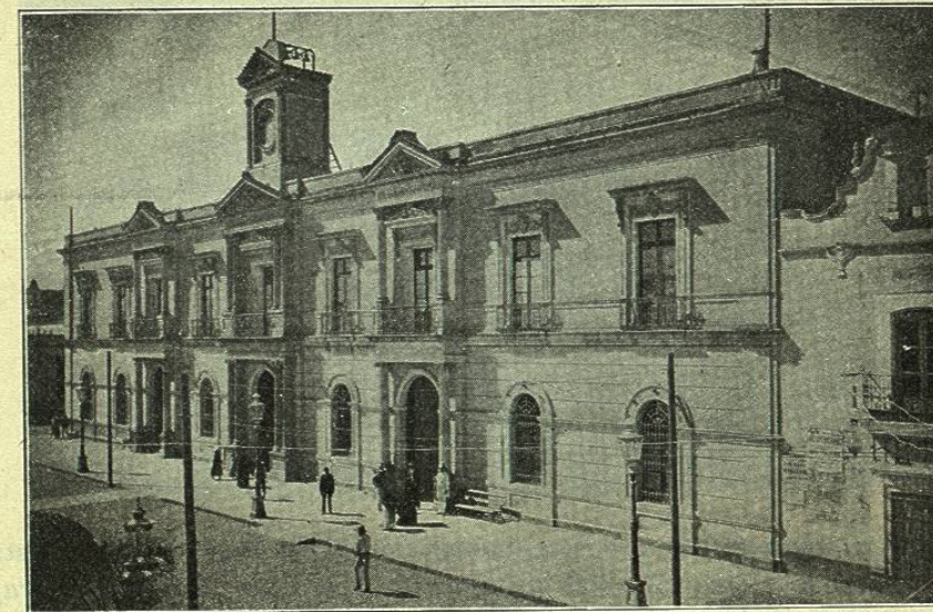
TOLUCA.— PALACIO DEL PODER EJECUTIVO

Todas estas poblaciones son muy antiguas; han sido fundadas la mayor parte de ellas por los indígenas antes de la Conquista, y conservan recuerdos históricos y curiosas ruinas de tiempos lejanos que se remontan hasta los toltecas. Las más interesantes desde este punto de vista son las de Chalco, Texcoco y otras que fueron un tiempo capitales de poderosos aunque pequeños reinos indígenas.