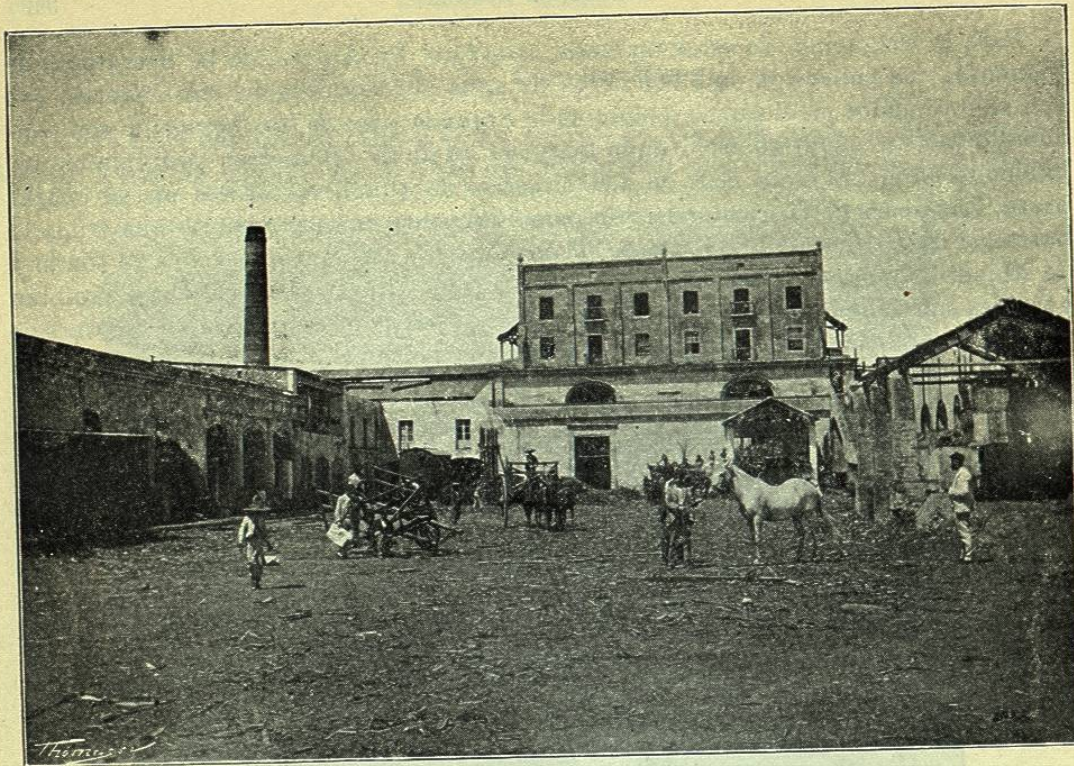
VISTA GENERAL DEL «INGENIO SANTA INÉS»