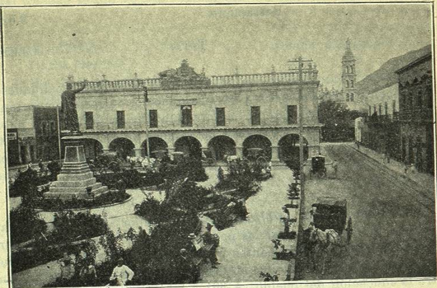
MONTERREY. — PALACIO MUNICIPAL EN LA PLAZA DE HIDALGO

Sociedad Pedagógico-Mutualista, que tiende á la ampliación de los conocimientos pedagógicos de sus asociados y los auxilia pecuniariamente, y por último la Asociación Médico-Literaria de Monterrey, cuyo objeto es el estudio de las ciencias médicas.