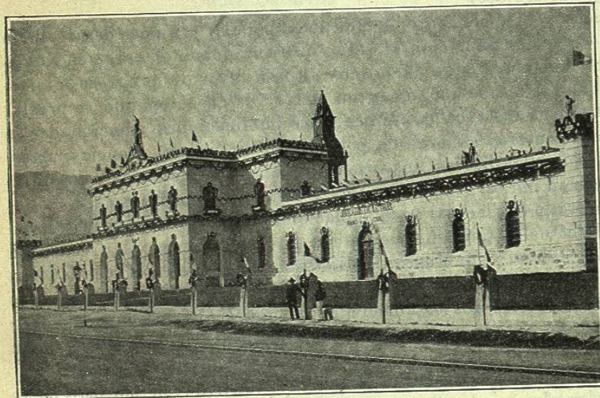
VISTA GENERAL DE LA PENITENCIARÍA DE MONTERREY

VI. Poblaciones principales del Estado. — Su industria y comercio. — La primera población del Estado y sexta de la República por el número de sus habitantes y por su industria y comercio es la ciudad de Monterrey, capital de Nuevo León.