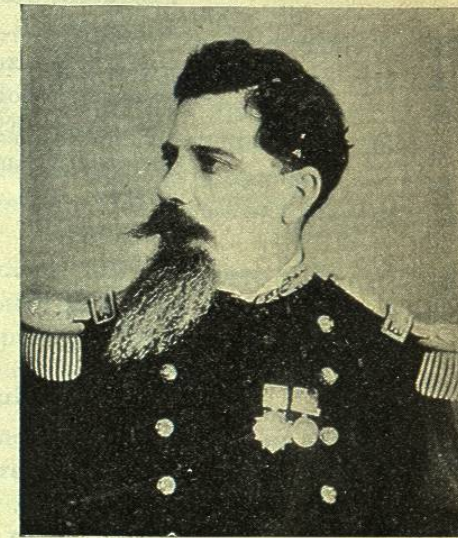
GENERAL D. BERNARDO REYES Gobernador del Estado de Nuevo León

Eclesiásticamente corresponde el Estado de Nuevo León al Arzobispado de