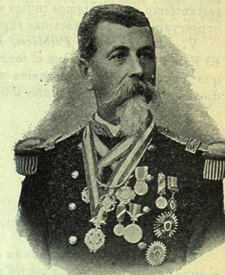
GENERAL MUCIO P. MARTÍNEZ Gobernador del Estado de Puebla

tres poderes Ejecutivo, Legislativo y Judicial, desempeñando el primero actualmente el distinguido ciudadano General D. Mucio P. Martínez, que ocupa por segunda vez tan alto puesto. Este pundonoroso militar es hijo del Estado de Nuevo León, habiendo nacido en Galeana el año 1841, y desde bien joven se dedicó á la milicia, distinguiéndose muy pronto en su carrera, pues en la batalla de San Lorenzo , ocurrida el 8 de Mayo de 1863, alcanzó el grado de capitán por méritos de guerra. Hallóse en el combate de Huitzilac, en el que fué herido gravemente, permaneciendo 3 días abandonado en el campo de batalla entre los muertos y otros heridos, hasta que fué recogido por una sección de tropa que mandaba el capitán D. Bonifacio Castelo. Después de curado regresó á las filas y tomó parte en multitud de hechos de armas, llamando en todos ellos la atención su valor y serenidad, y su ardor en el ataque. Estuvo en Comitlipa, en Tlajiaco, en Nochistlan, en la batalla de Miahuatlan, en la famosa de la Carbonera contra los austriacos, en el sitio y toma de Oaxaca, en el glorioso asalto de Puebla, y por último en el sitio de México, y otros muchos encuentros que sería prolijo relatar. En 26 de Marzo de 1884 fué ascendido á general de Brigada, habiendo pasado por los grados intermedios que conquistó siempre con méritos de guerra.