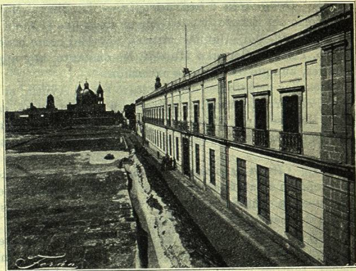
QUERÉTARO. — COLEGIO CIVIL