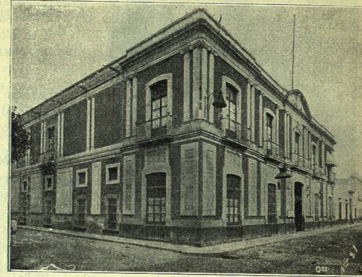
QUERÉTARO. — PALACIO DE GOBIERNO

sin descanso en la tarea de mejorar gradualmente todos y cada uno de los ramos de su incumbencia, bajo un plan administrativo inteligente y concienzudo. La salubridad, la instrucción pública, la seguridad individual, la organización de las rentas, el fomento de la industria, el arreglo completo de la legislación, la administración de justicia, las mejoras materiales de comodidad y de ornato, las vías de comunicación, las líneas telefónicas, todo, en fin,