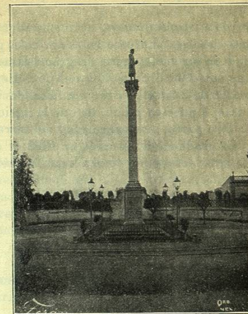
QUERÉTARO.—MONUMENTO Á COLÓN

La industria y el comercio, especialmente la primera, revisten importancia. Hay fábricas de varios productos y grandes molinos de trigo, distinguiéndose entre aquéllas la gran fábrica de hilados y tejidos de algodón Hércules , cuyas edificaciones y maquinarias son sumamente notables. Baste decir, para muestra de la suntuosidad con que se construyó esta fábrica, que la estatua del dios mitológico, colocada á la entrada justificando su nombre, fué fundida en Italia y costó 14.000 pesos. Es admirable también y representa un costo enorme, el gran acueducto por donde se