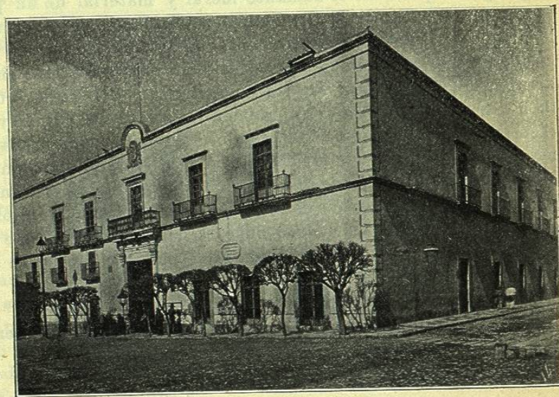
QUERÉTARO.—CASA DE LA CORREGIDORA, HOY PALACIO MUNICIPAL