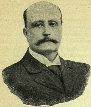
D. FRANCISCO GONZÁLEZ COSÍO Gobernador del Estado de Querétaro