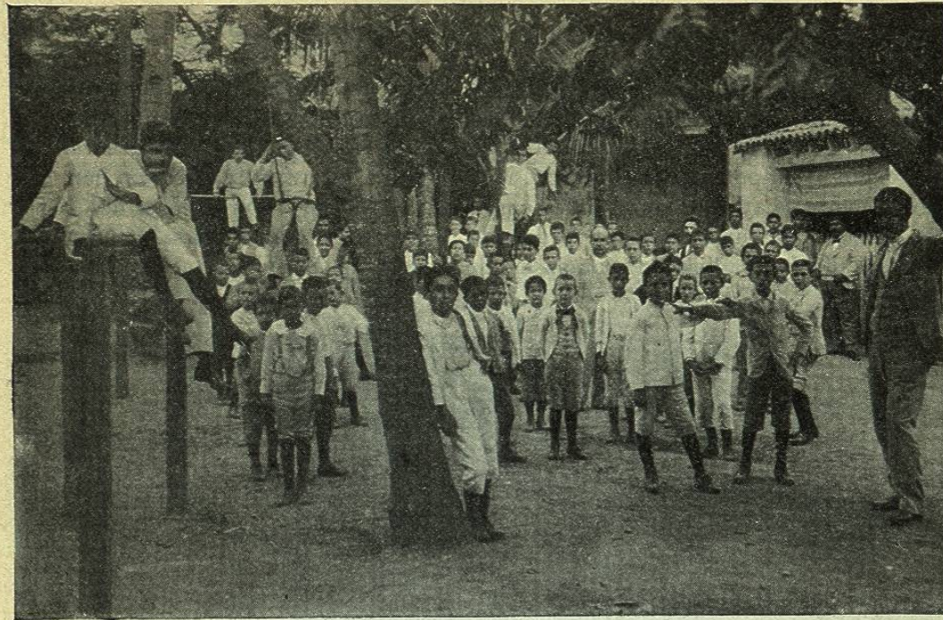
MAZATLÁN. — PATIO EN EL INSTITUTO SINALOENSE

esferas, carteles, etc., en cada uno de ellos es más que suficiente. Tiene también su departamento de Biblioteca, gabinetes de Física y Química, oficina de ensaye, gimnasio, y en una palabra, cuanto se precisa para montar á la moderna un establecimiento de este género.