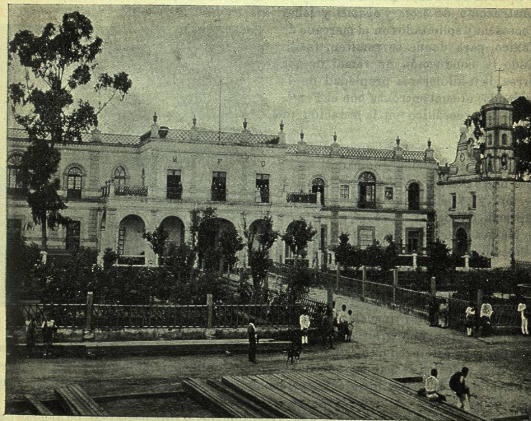
FACHADA DE LA HACIENDA DE SAN BARTOLOMÉ DEL MONTE