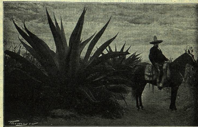
ALTURA DE UN «MAGUEY», COMPARADA CON LA DE UN JINETE

Para terminar esta pequeña descripci6n diremos que los edificios de la hacienda, reconstruidos recientemente, casi en su totalidad comprenden una elegante y amplia casa-habitaci6n, una preciosa capilla, cómodas y aseadas casas para de-