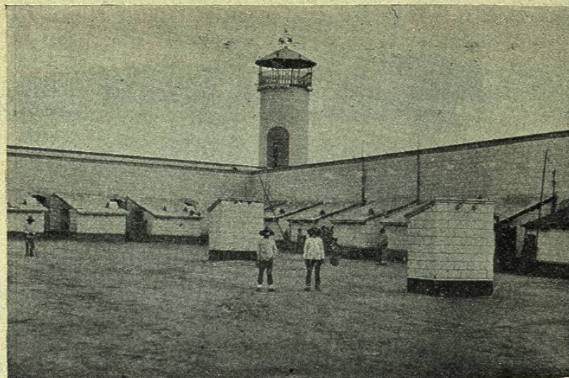
VISTA INTERIOR DE UN PATIO

labor cubiertas de plantíos de maguey, y 7.500 hectáreas de monte, en donde pastan grandes rebaños de ganado vacuno, caballar y lanar.