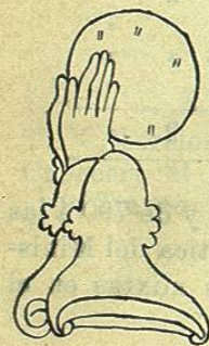
Jeroglífico de Tlaxcallan (lugar del pan de maíz ó tortillas)

Hoy es una población de 2.874 habitantes según el censo de 1895, triste y silenciosa, sin hoteles decentes donde se pueda guarecer el forastero, sin industria y sin comercio, como no sean algunas fondas más parecidas á las barracas de feria que á los comercios de una capital. Está