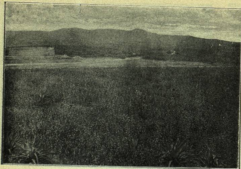
VISTA PANORÁMICA DE LOS TERRENOS DE LA HACIENDA

No vacilamos en asegurar que esta hacienda ocupa lugar distinguido entre las mejores de la República.