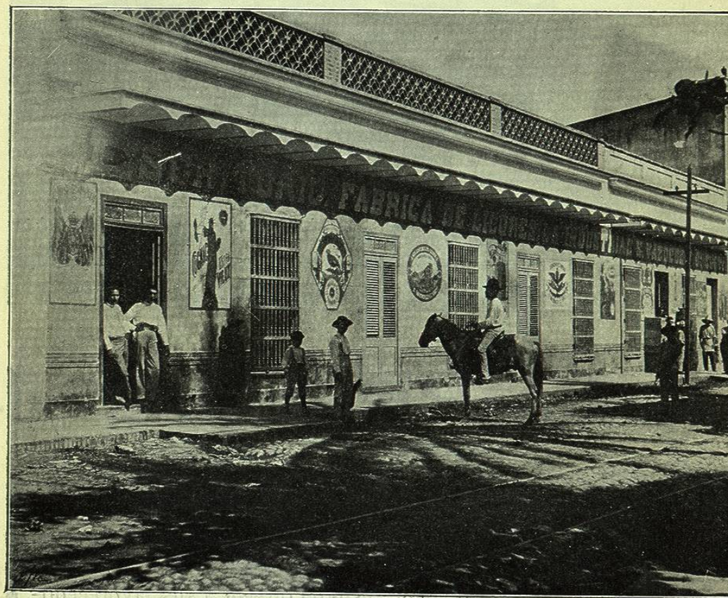
VISTA DE LA FÁBRICA DE LICORES LA INDUSTRIAL

Recomendamos esta importante casa como una de las principales de la República, por la excelencia de sus caldos.