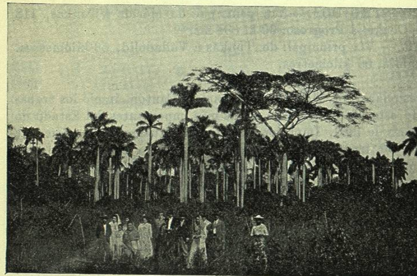
BOSQUE DE PALMERAS EN YUCATÁN

De cualquier modo, los datos anteriores más ó menos inexactos dejan sin embargo suponer la riqueza considerable que encierra la agricultura yucateca y hacen esperar un gran porvenir para el Estado cuando mayor nú-