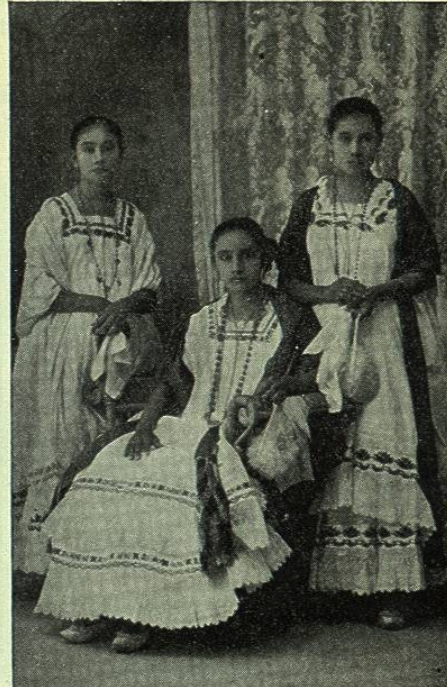
MÉRIDA. — GRUPO DE MESTIZAS

VII. Agricultura. — La gran riqueza de Yucatán consiste en el cultivo del henequén, el de maíz y en la explotación del palo campeche. Tan sólo estos tres artículos representan un valor anual de muchos millones de pesos y ellos distraen casi por completo la atención de todos los agricultores del Estado. Hay otras producciones, sin embargo, como vamos á verlo en el siguiente cuadro de las obtenidas el año 1897: