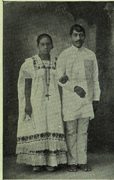
MÉRIDA. — NOVIOS MESTIZOS

fábrica de hilados y tejidos de algodón, varias de aguardiente, y otras de pólvora, de fósforos, de calzado, de baúles, de velas y jabones, etc., así como casas mercantiles muy notables en el ramo de importación y exportación de artículos en general. Una industria importante no sólo de Mérida sino de otros pueblos del Estado es la fabricación de artefactos de carey y nácar y el preparado de un polvo de cascarilla y concha usado por las señoras en su tocador y muy estimado en Cuba, según un geógrafo.