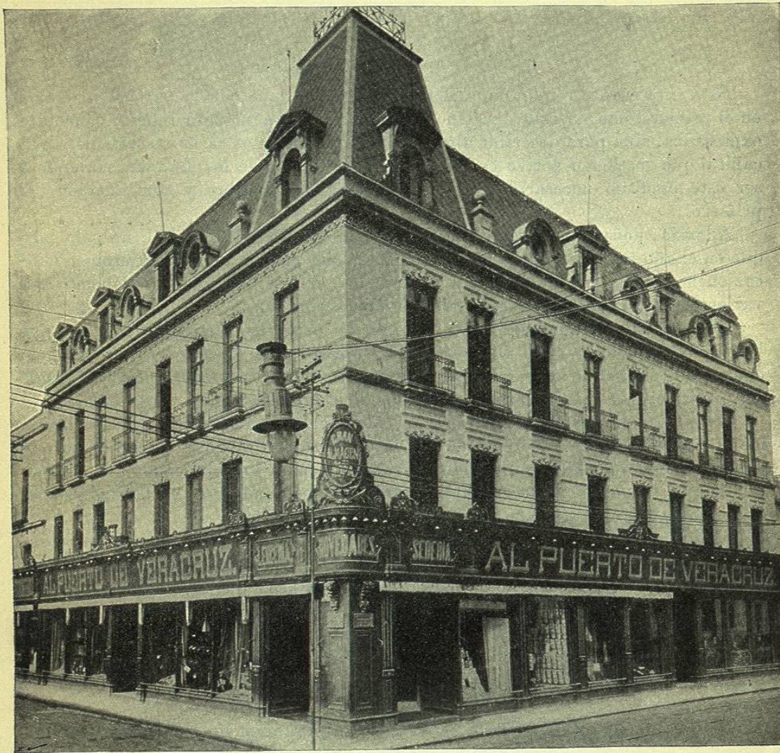
VISTA DE LA CASA DE COMERCIO AL PUERTO DE VERACRUZ

Gracias á una administración inteligente y progresista, el Puerto de Veracruz cuenta con la más selecta y más aristocrática clientela, tanto de México como del interior de la República. Los clientes, atendidos con la mayor solicitud por un personal escogido y bajo la dirección de jefes prácticos y competentes, encuentran en sus numerosos departamentos el surtido más variado que se pueda apetecer, y podemos decir sin exageración que todos los artículos que vende esta casa llevan el sello del gusto más delicado.