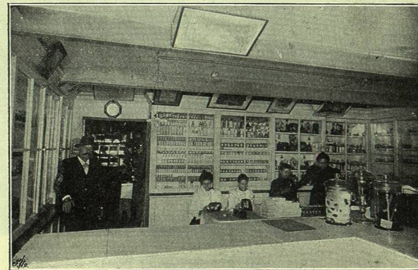
DESPACHO AL POR MENOR EN LA PERFUMERÍA

P. SAINT MARC SUCESOR. —Fábrica de jabones y perfumes 2.º Callejón de Santa Clara, núm. 13 bis. — Apartado 702. MÉXICO D. F.