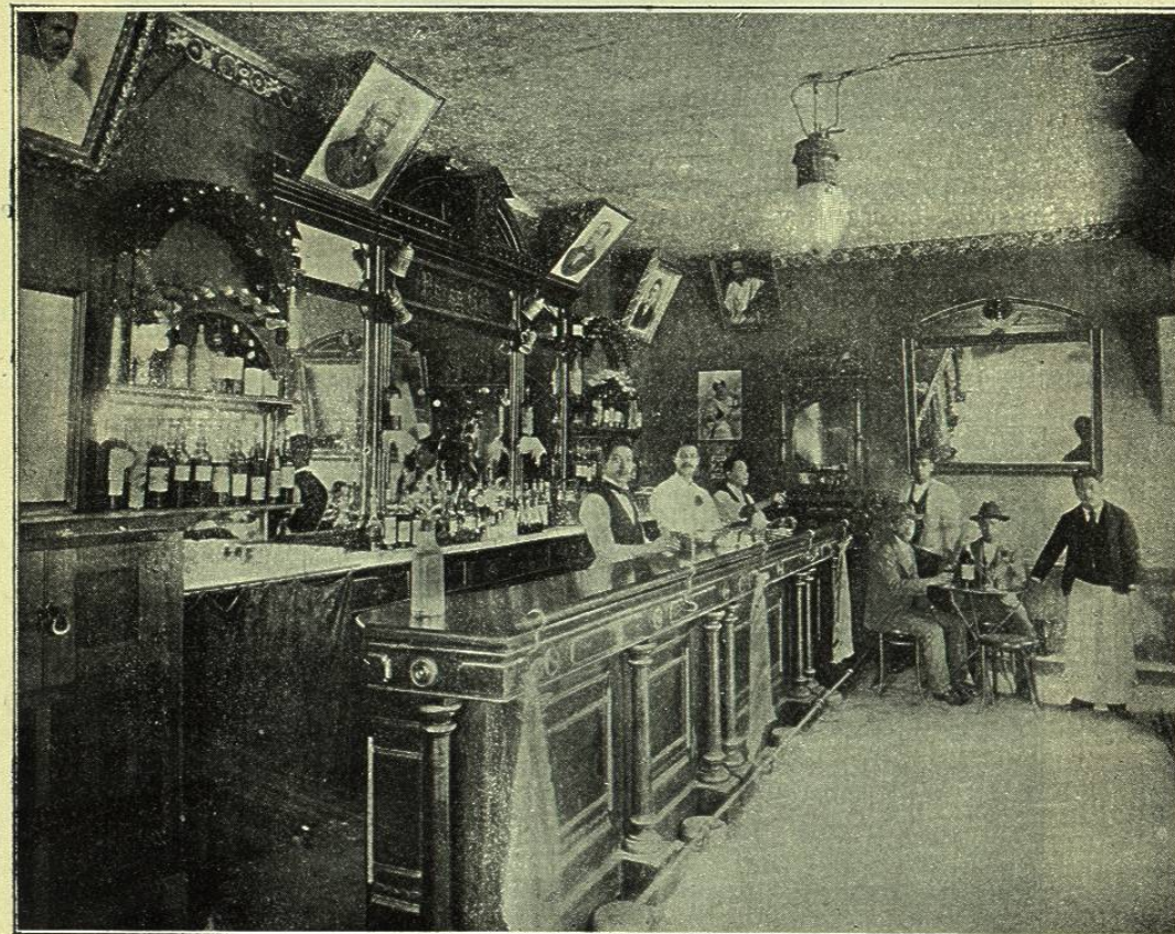
VISTA INTERIOR DE LA CANTINA PETER GAY