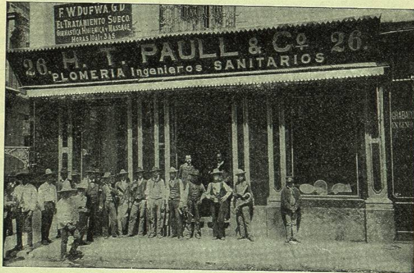
GRAN PLOMERIA DE H. PAULL Y C. a

de H. T. PAULL y C. a , Ingenieros sanitarios Alcaicería, núm. 26. — MÉXICO