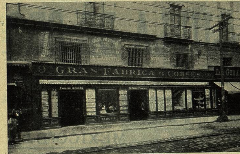
Fábrica de corsés, de A. Lavillette.

1. a de la Monterilla, n.º 9 — MÉXICO, D. F.