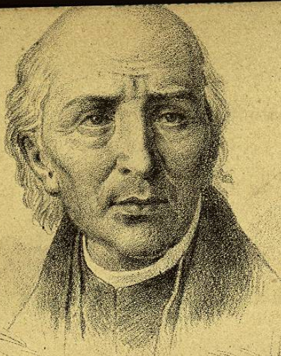
Miguel Hidalgo y Costilla