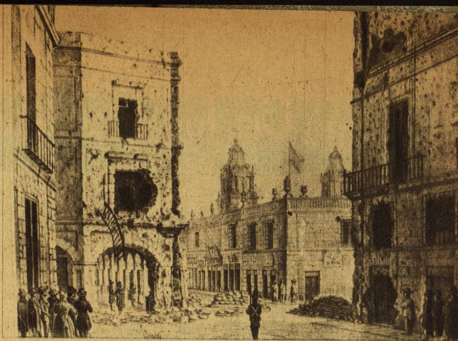
Vista de la esquina de los Portales y costado de la casa municipal de México, después de la memorable jornada del 15 al 26 de julio de 1840.

Ahincado en los estudios matemáticos y tácticos, antojábase que su vida de cadete se deslizaría entre el romance y el amor; entre ilusiones y aventuras mozas, entre exámenes y juegos de guerra. Pero héte que la tragedia que ha sacudido por muchos años a nuestra patria, la tragedia honda y dolorosa, con sus turbiones de pólvora y sus hecatombes de sangre, señoreó nuevamente a la "Ciudad de los Palacios" y clavó sus garfios rojos en el corazón de todos los capitalinos, envolviendo a hombres y mujeres, adultos y niños, liberales y conservadores. En la fecha luctuosa a que aludo, más que nunca sufrió daños la metrópoli y deterioros el Palacio Nacional, en que casi desapareció el torreón Sur, los garitones de mampostería quedaron semidestruidos; las esquinas de los portales de Mercaderes y de Agustinos, así como las alacenas, con agujeros y desplomes y, finalmente, infinidad de