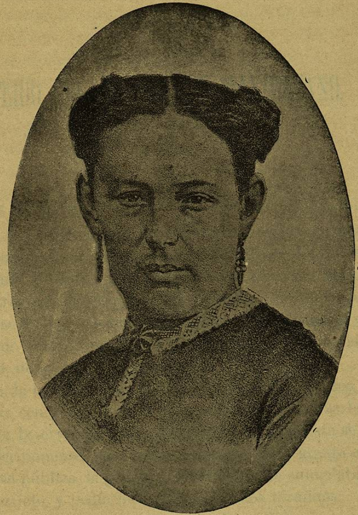
SEÑORA MARGARITA MAZA DE JUAREZ.