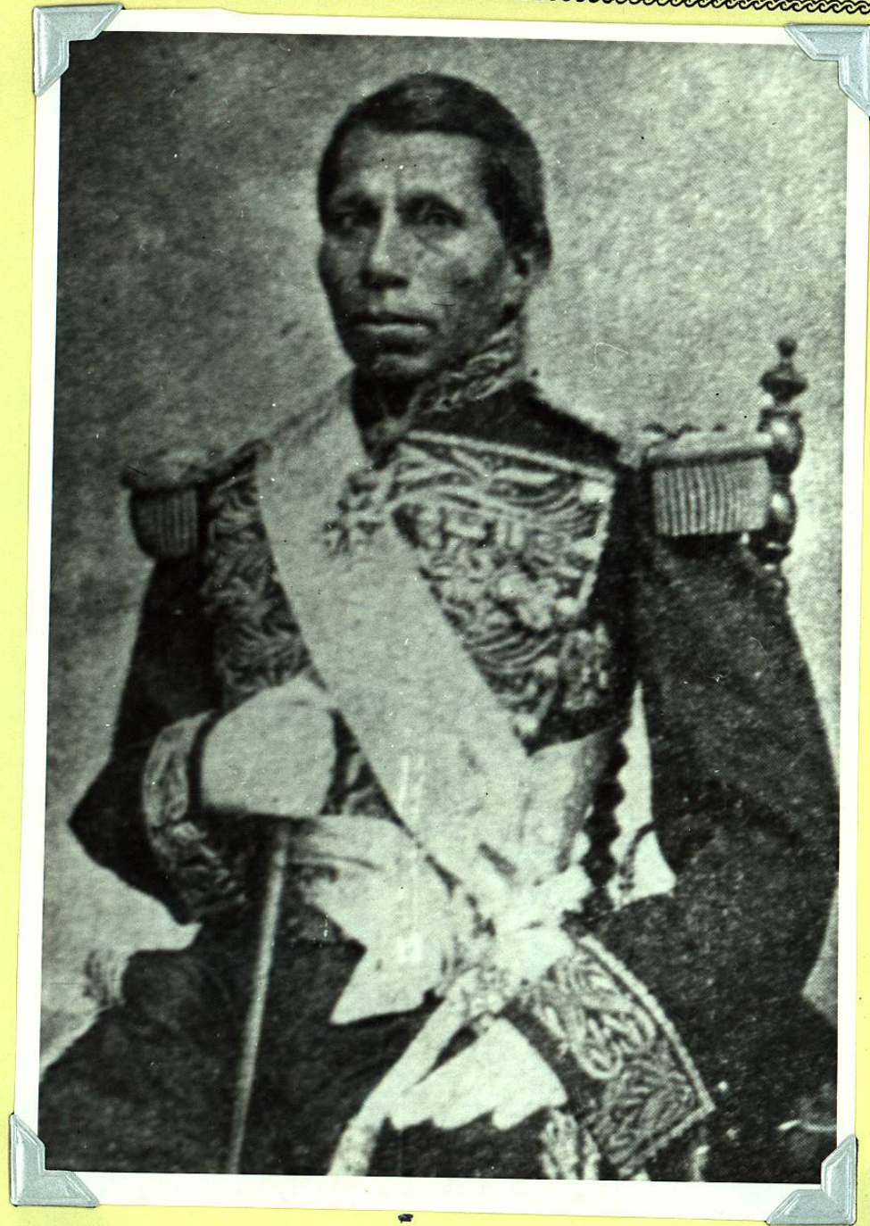
SEÑOR GENERAL DE DIVISION DON TOMAS MEJIA.