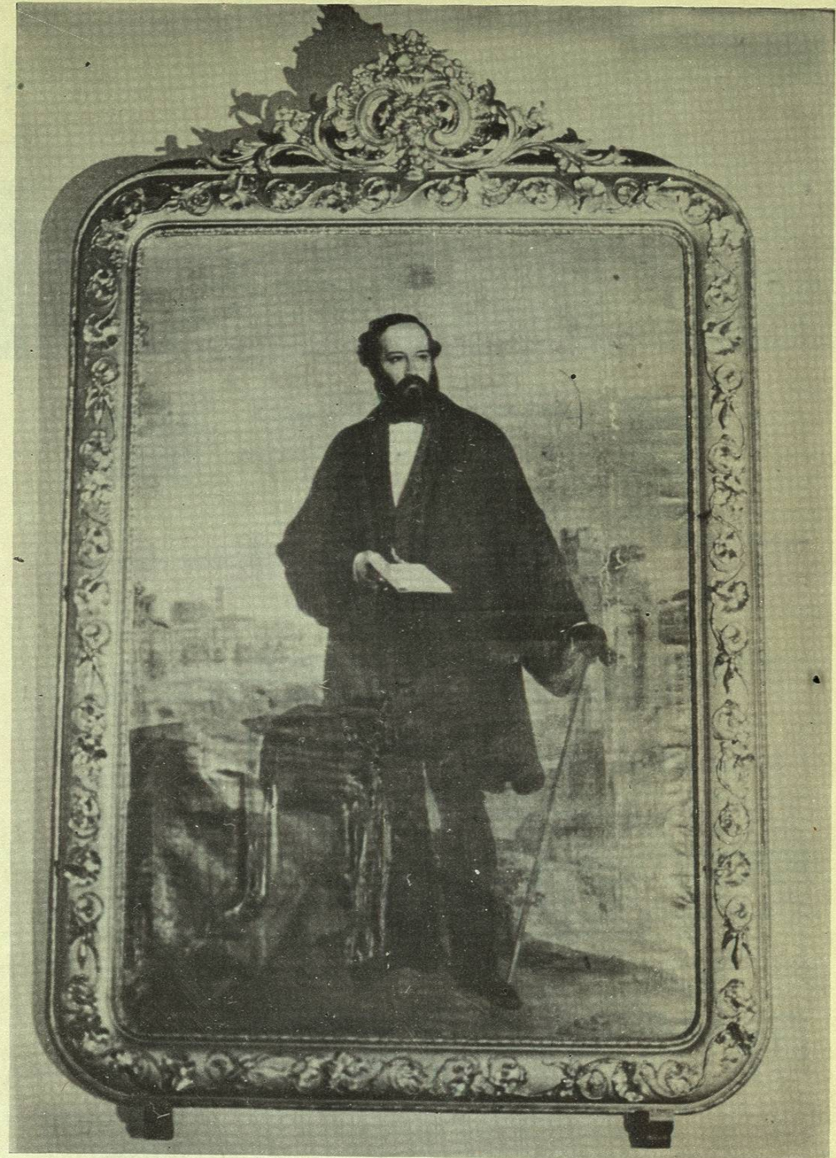
Retrato al óleo con su hermoso marco dorado del Prócer Jurista y Diplomático queretano Don Ezequiel Montes, pintado en Roma cuando fué Ministro Plenipotenciario de México ante la Santa Sede.- Se encuentra actualmente en el Cabildo Municipal de Cadereyta de Montes, Querétaro.