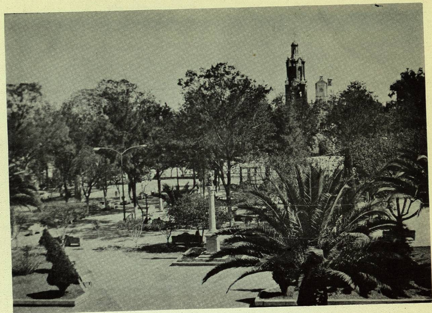
Jardín principal de la Plaza Mayor de Cadereyta, Qro.- Al fondo la Parroquia.