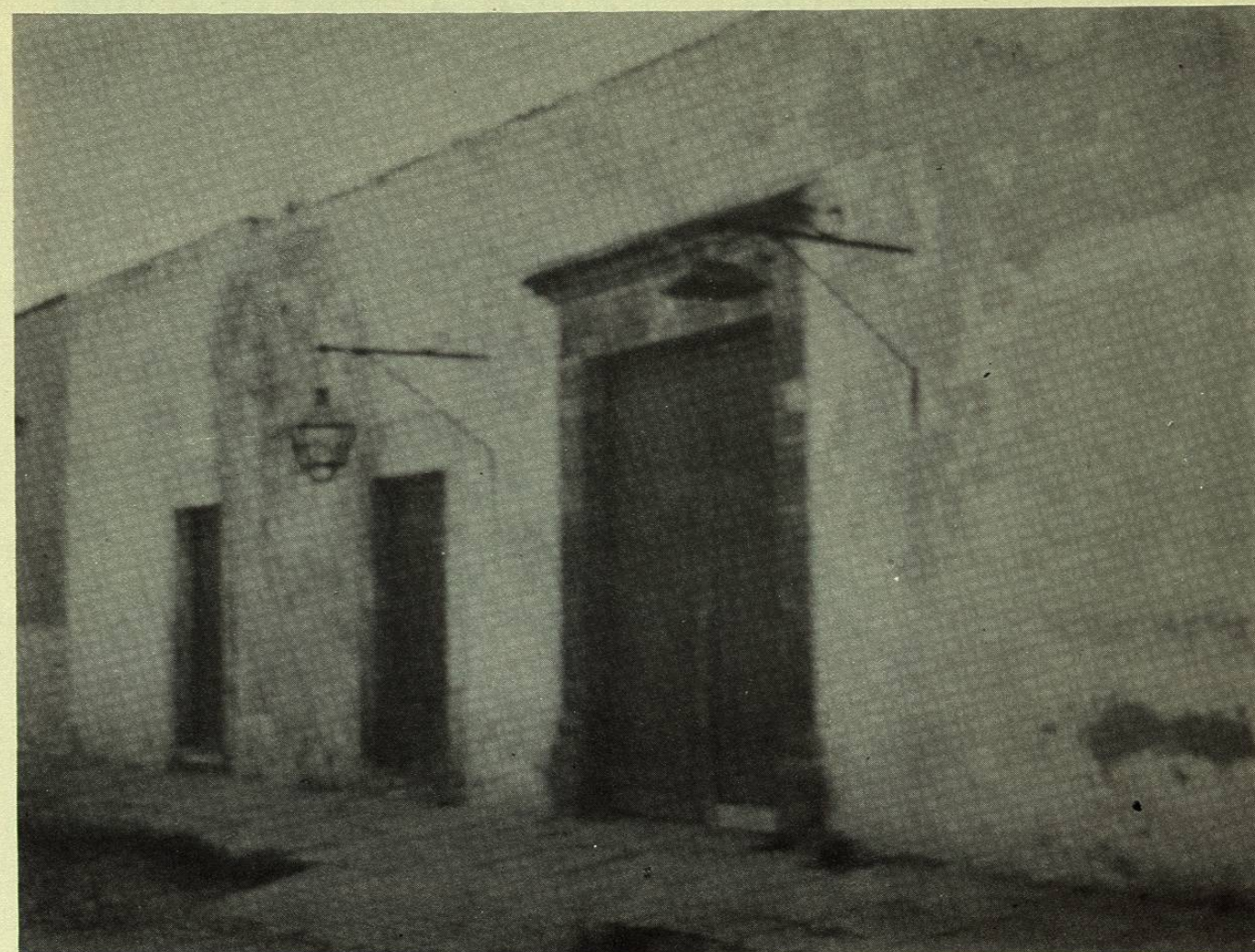
Casa del Siglo XVIII, en donde según informaciones de vecinos de Cadereyta, probablemente nació D. Ezequiel Montes en 1820.