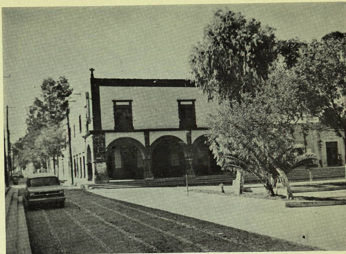
Sobria y Señorial Casona en la Plaza Mayor de Cadereyta, Qro.