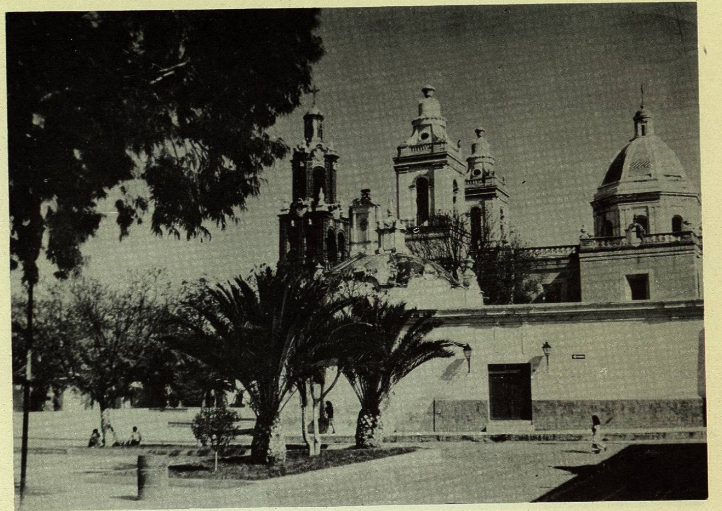
Exteriores de la Parroquia de Cadereyta, y Templo de la Soledad.- Siglo XVIII, Cadereyta, Qro.