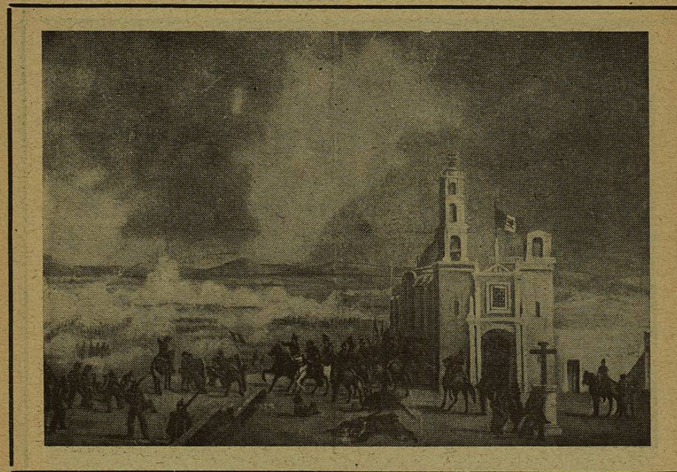
IGLESIA DE LOS REMEDIOS

El enemigo lanzó su primera columna (c) sobre Guadalupe, precedida de una fuerte y extensa cadena de tiradores. Rechazado este ataque, lanzó su segunda columna (d) que había ocultado tras de la cantera (X), y el Gral. Berriozábal para batirla de flanco, tuvo que hacer un cambio de frente a vanguardia sobre su derecha, y tomar la posición (A), y a la vez reforzó el Fuerte de Guadalupe con dos Compañías del 1/o Ligero de Toluca. En estos momentos fué auxiliado por el Batallón "REFORMA" de San Luis, que tomó la posición (B) a la vez el resto de la Columna Lamadrid tomó la posición (B) y la Columna Díaz reforzada con "LANCEROS DE OAXACA", "LANCEROS DE TOLUCA" y "ESCUADRON TRUJANO", tomó la posición (C). El resto de la Caballería tomó la posición (D).