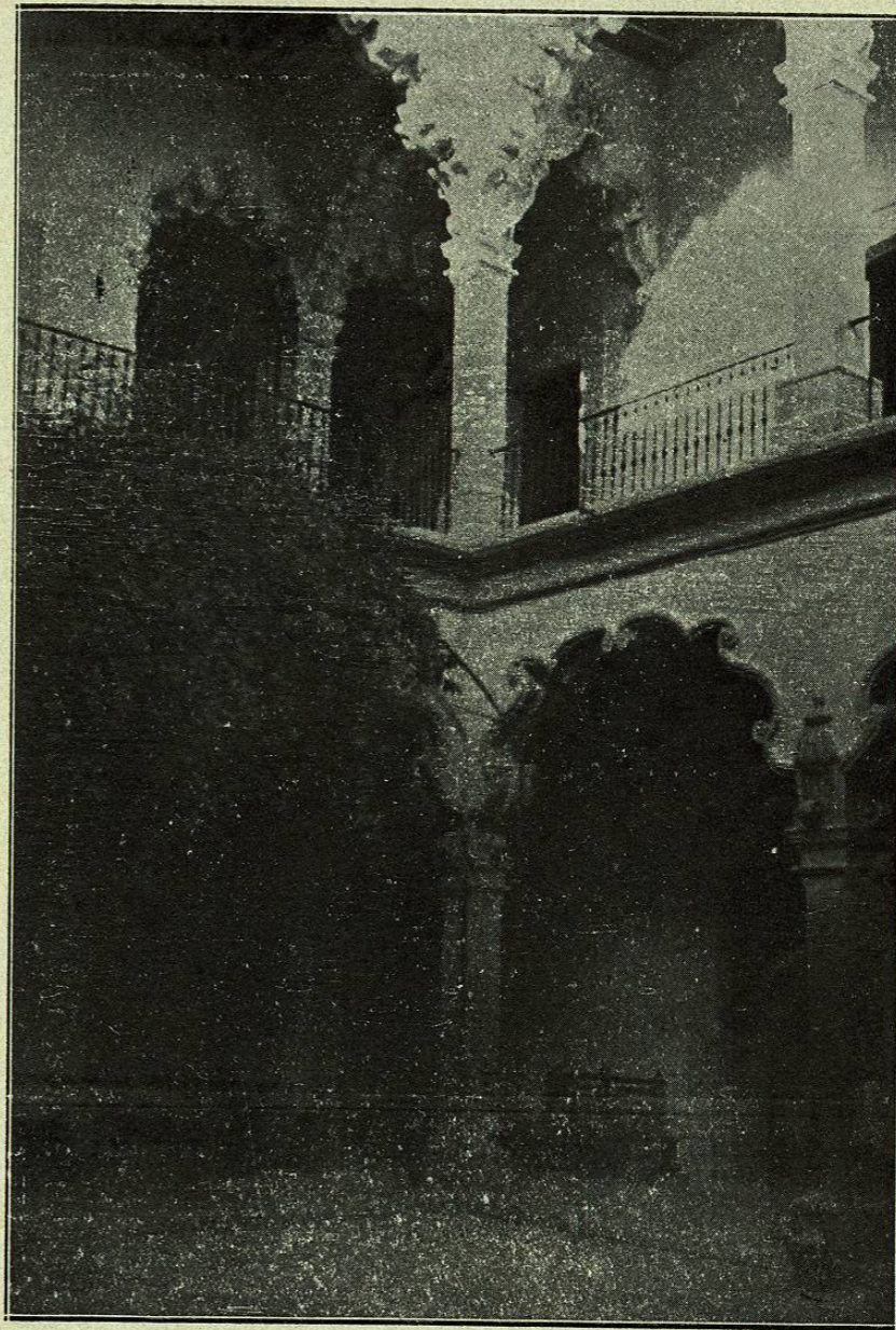
Otro aspecto del patio