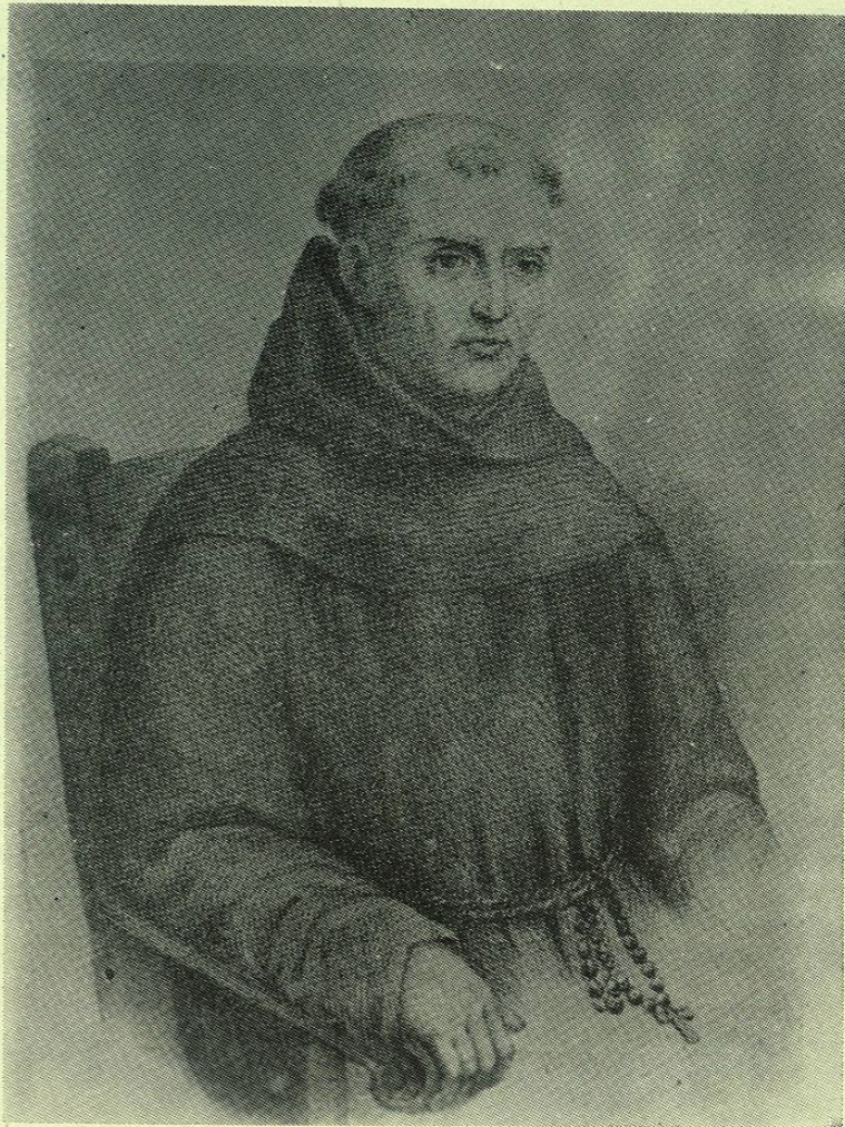
Fray Junípero Serra.