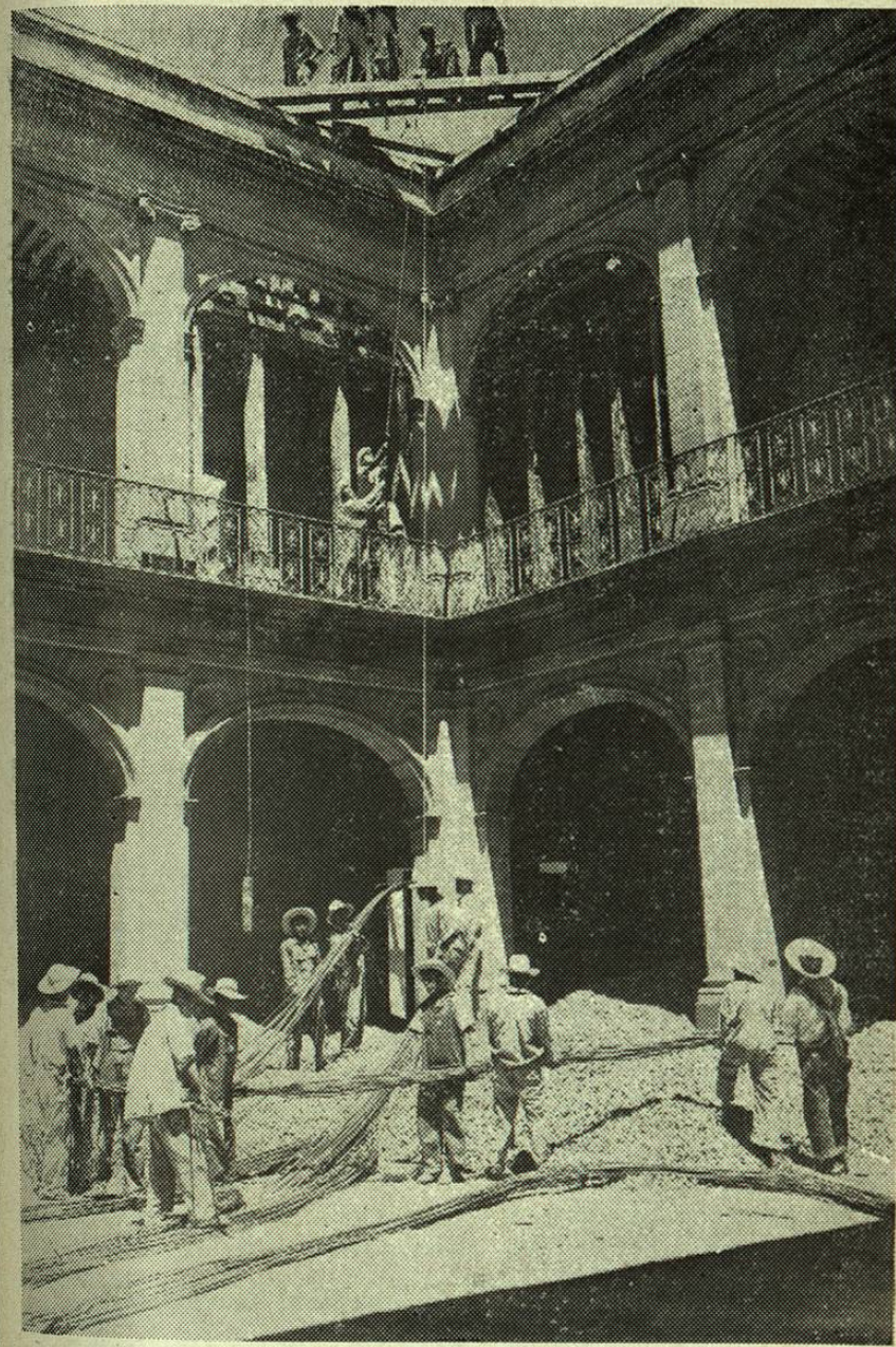
Patio de Honor del antiguo Palacio de Gobierno en reconstrucción