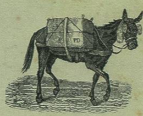
Tipografía de R. Rafael.