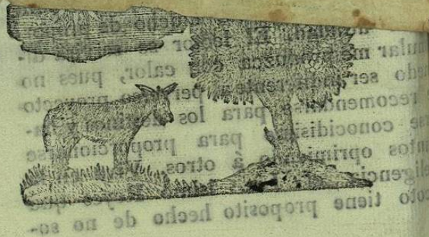
esto tiene proposito hecho de no se-