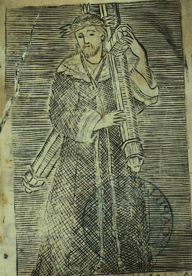
V. R. de Jesús Nazareno tocada al Original se venera en su Santuario de Atotonilco en Señora Illma. concedio 20 dias de Indulg. al q. rezare un

[Faint, mostly illegible text, possibly bleed-through from the reverse side of the page.]