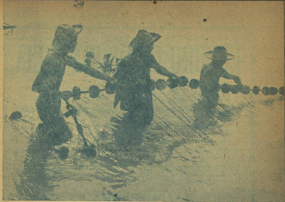
Pescadores típicos de la región lacustre tuxtleca.

The huge Head of Huayapan weighing about 20 tons, it is one of the archaeological wonders of the region.