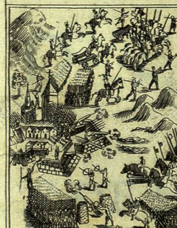
Fuerte de Santiago de Chile