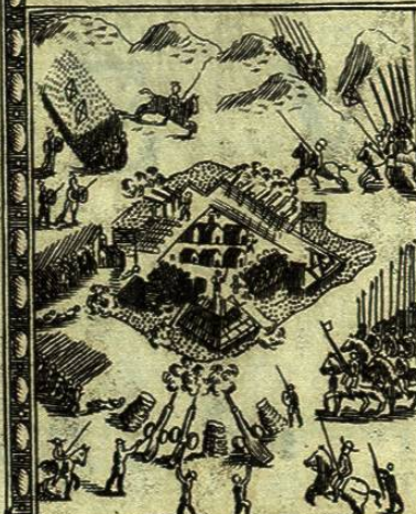
Adelantado Soto gana el fuerte de Alibano