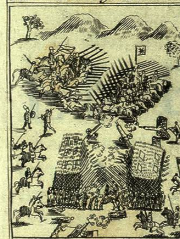
Batalla de Quilacura en Chile