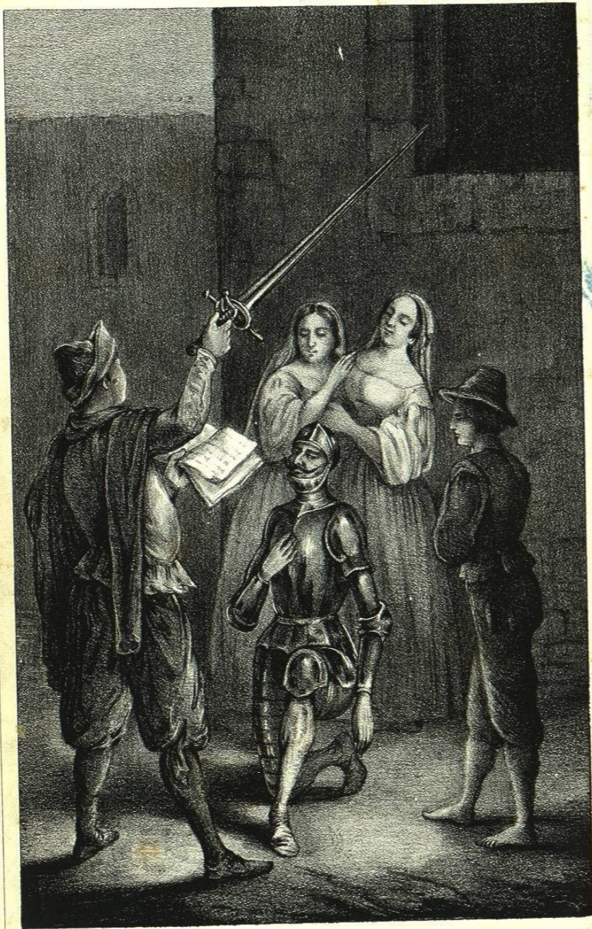
Imprenta Lito. callejon de S a Clara N.º 8.