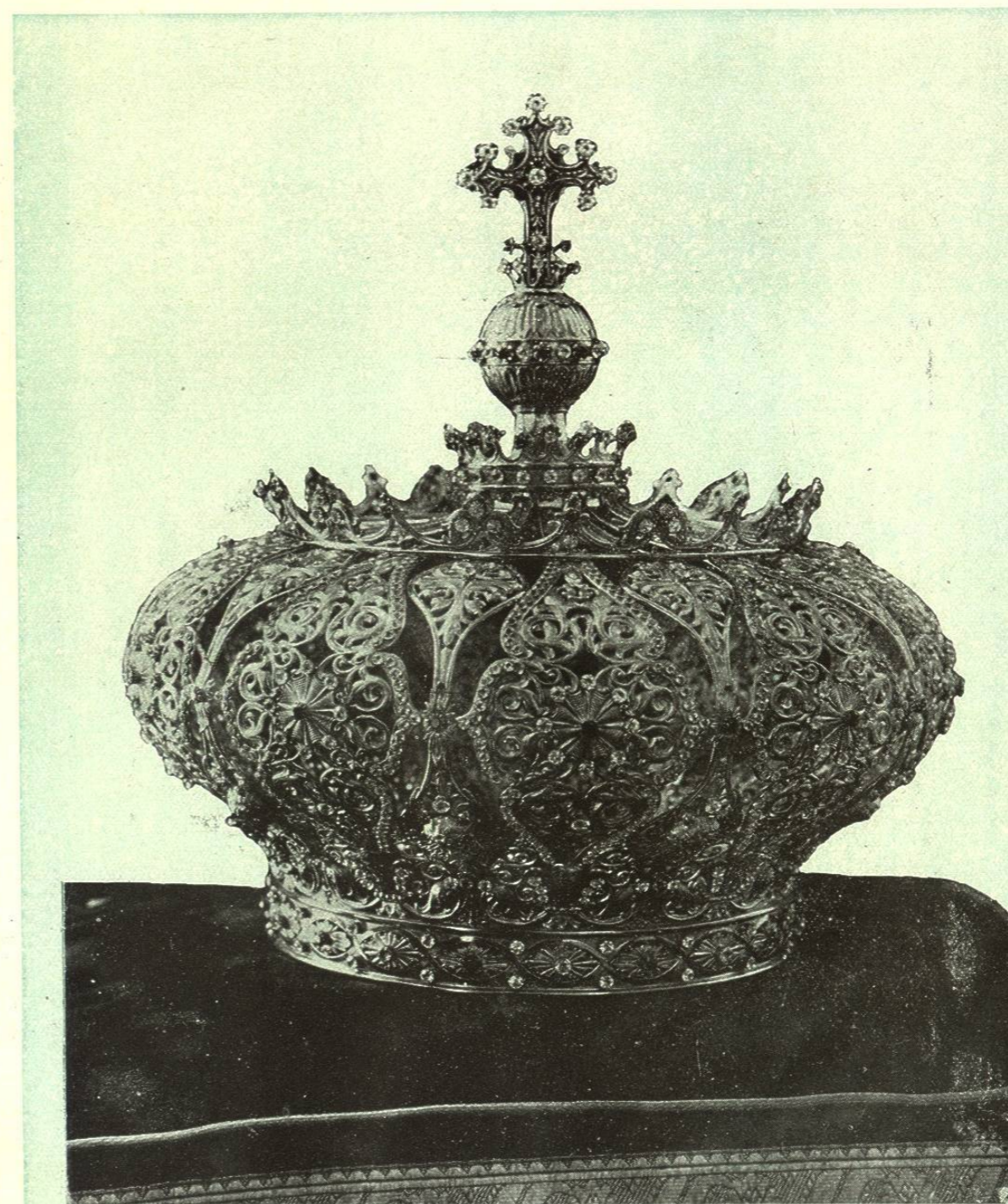
Corona de la Madre Santísima de la Luz, colocada en León sobre la milagrosa imagen el 8 de Octubre de 1902, y fabricada como una espléndida joya por la casa de los señores Benziger Brothers, de Nueva York.