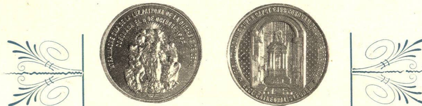
Medalla conmemorativa de la solemne coronación de la Madre Santísima de la Luz, hecha por la casa de los Sres. Benziger Brothers. Obsequio fué éste que se hizo á los Ilmos. Prelados y á muchas personas distinguidas que concurrieron á la imponente ceremonia.