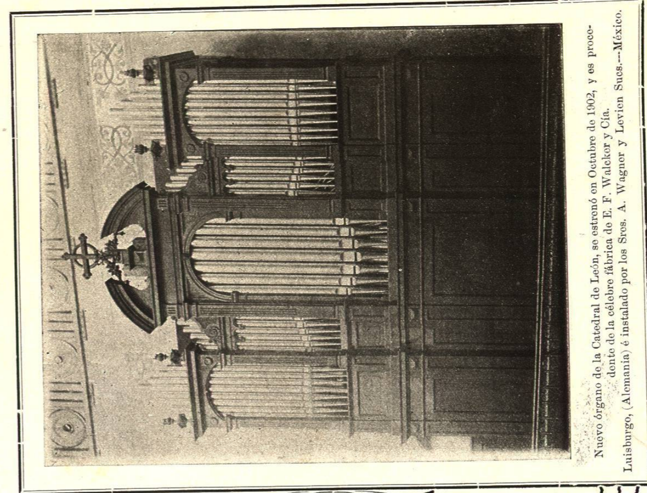
Nuevo órgano de la Catedral de León, se estrenó en Octubre de 1902, y es procedente de la célebre fábrica de E. F. Walcker y Cía. Luisburgo, (Alemania) é instalado por los Sres. A. Wagner y Levien Sues.—México.