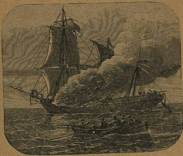
Incendio del Oriente .

pero su padre, herido mortalmente, no podía oír su voz. Un marinero viejo corre hacia él y le dice: « Vuestro padre está moribundo, y os ordena rendiros y salvar vuestra vida, como á mí tambien. » El niño, fuera de sí, corre al camarote donde estaba espirando el contra-almirante, le abraza estrechamente y jura no abandonarle. En vano su padre emplea los ruegos y el poder de su autoridad; en